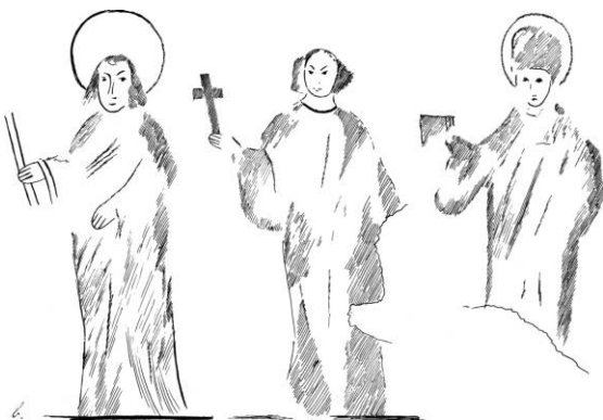
Fig. 43a-c. †Kalkmalede figurer, fra 1500ernes 1. trediedel i korhvælvet (s. 4122). Skitser ved Frantz Hansen 1904, i NM. - †Mural paintings from the 1st third of the 16th century on the vault of the chancel. Sketch drawing 1904 by Frantz Hansen, in NM.

43 Med godset var kirken pantsat og misligholdt ved statens overtagelse. Murermester C. Qvist fra Skanderborg havde kontrakt på vedligeholdelse. I en udlægsforretning 1821 bemærkes, at udbygningen er afsluttet fra kirken. RA. Rtk. Jy-fynske landvæsenkt. Kopibog 1823 og Finansark. Dir. statsgælden og den synkende fond. Kt. statsaktiverne. Silkeborg gods 1819-24.