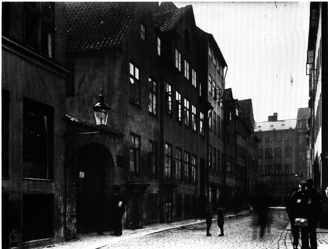
Fig. 133. Porten fra Brøndstræde til den tidligere stiftelses gård. M. Mackeprang fot. 1909. — Gate from Brøndstræde, into the courtyard of the former institution.