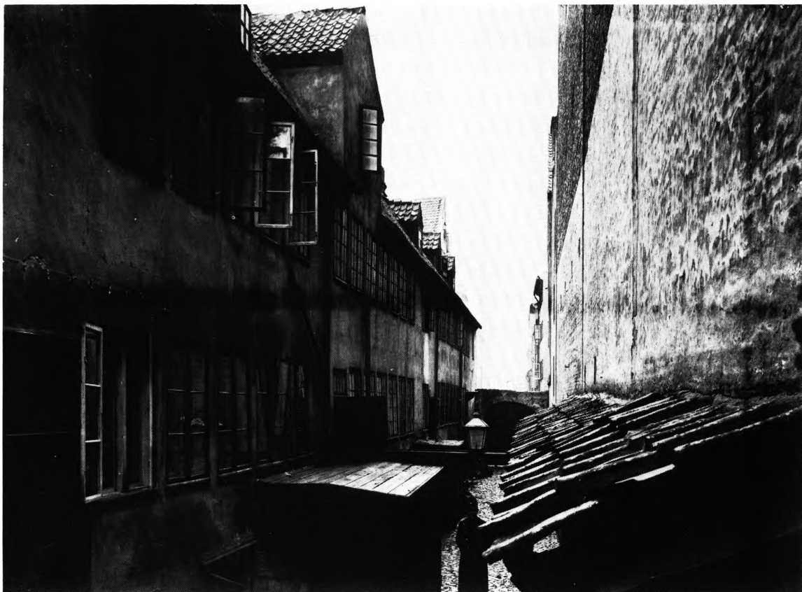
Fig. 136. Sidehus oprindelig opført til Brøndstræde Hospital 1731-34. M. Mackeprang fot. 1909. – Side-house originally built for the Brøndstræde Hospital 1731-34.

fattigvæsenets forskellige stiftelser, 8 mens lemmerne var henvist til altergang i byens sognekirker. En præstebolig blev indrettet i det forhus, som opførtes efter branden 1728, men et egentligt præstekald oprettedes først efter fattigdirektionens indstilling 1741. 9 Forholdene i tiden efter 1769 er omtalt i forbindelse med Almindelig Hospital (s. 201) og Abel Cathrines stiftelse (s. 160).