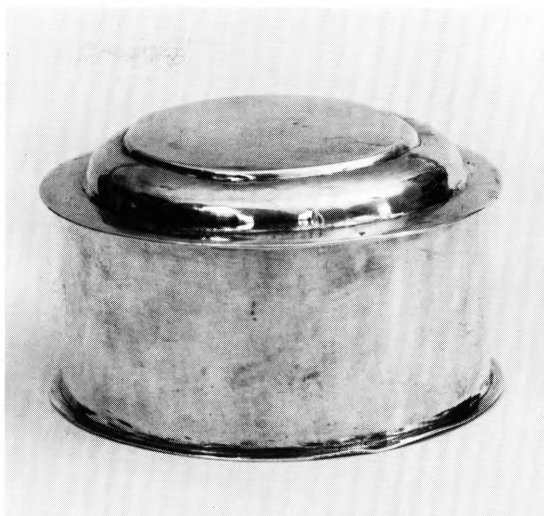
Fig. 139. *Oblatæske 1752, af Detleff Pape (s. 157). De gamles Bys kirke. NE fot. 1967. – * Wafer box by Detleff Pape 1752 .

† Alterstager . De stager, som repareredes 1768, 19 og 1769 befalede overført til Almindelig Hospital, er antagelig identiske med to gamle, ubrugelige messingstager nævnt i 1770-