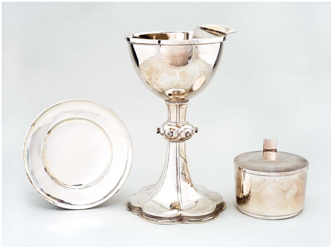
Fig. 7. Altersølv, 1902, bestående af disk, kalk og oblatæske, udført af guldsmed Lauritz Grønlund, Odense (s. 2998) samt oblatæske, 1982 (s. 2998). – Altar plate, 1902, consisting of the paten, chalice and wafer box, made by the goldsmith Lauritz Grønlund, Odense, as well as a wafer box, 1982.