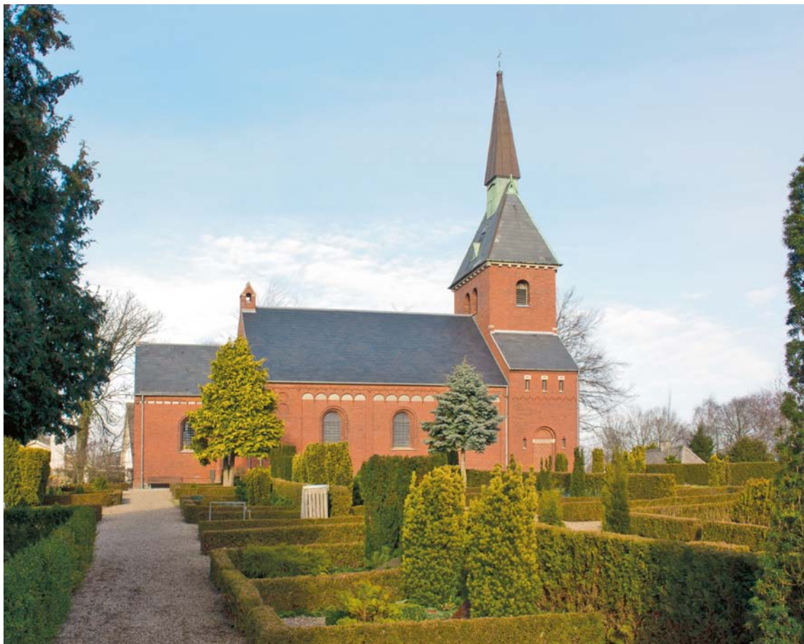
Fig. 1. Kirken set fra nord. Foto David Burmeister Kaaring 2014. – The church seen from the north.