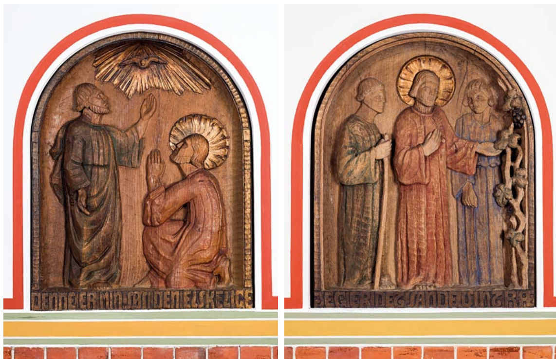
Fig. 5-6. Relieffer skåret af Niels Bang 1903 (s. 2998). 5. Dåben. 6. Det sande vintræ. Foto Arnold Mikkelsen 2013. – Reliefs carved by Niels Bang, 1903. 5. Baptism. 6. The True Vine.

halvcirkulær overside, viser hhv. »Dåben« og »Det Sande Vintræ«. I førstnævnte ses Jesus knælende ved Johannes' fødder og over dem Helligåndsduen i en strålekrans. Under billedet læses med forsænkede reliefversaler »Denne er min søn den elskelige« (Matt. 3,17). I sidstnævnte relief ses Jesus mellem to mænd, idet han med en talende gestus rører ved en vinranke. Under billedet læses »Jeg er det sande vintræ« (Joh. 15,1). De to relieffer er indsat i nicher i triumfbuens vanger.