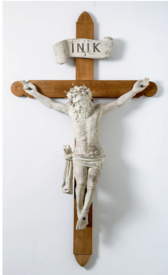
Fig. 12. Det forhenværende vejkrucifiks (s. 4480). – The former wayside cross.