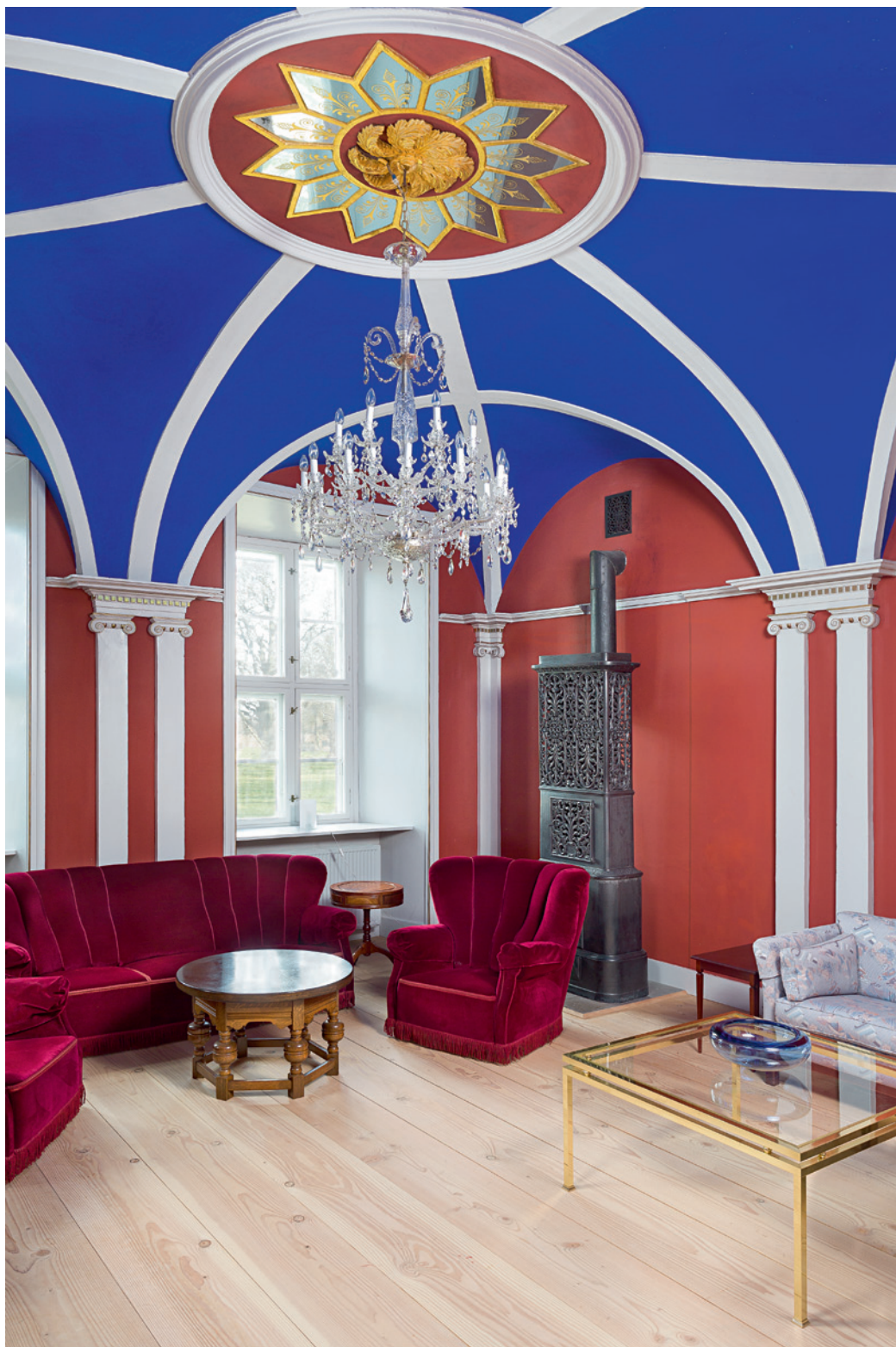
Fig. 2. Det forhenværende kapel. Foto Arnold Mikkelsen 2017. – The former chapel.