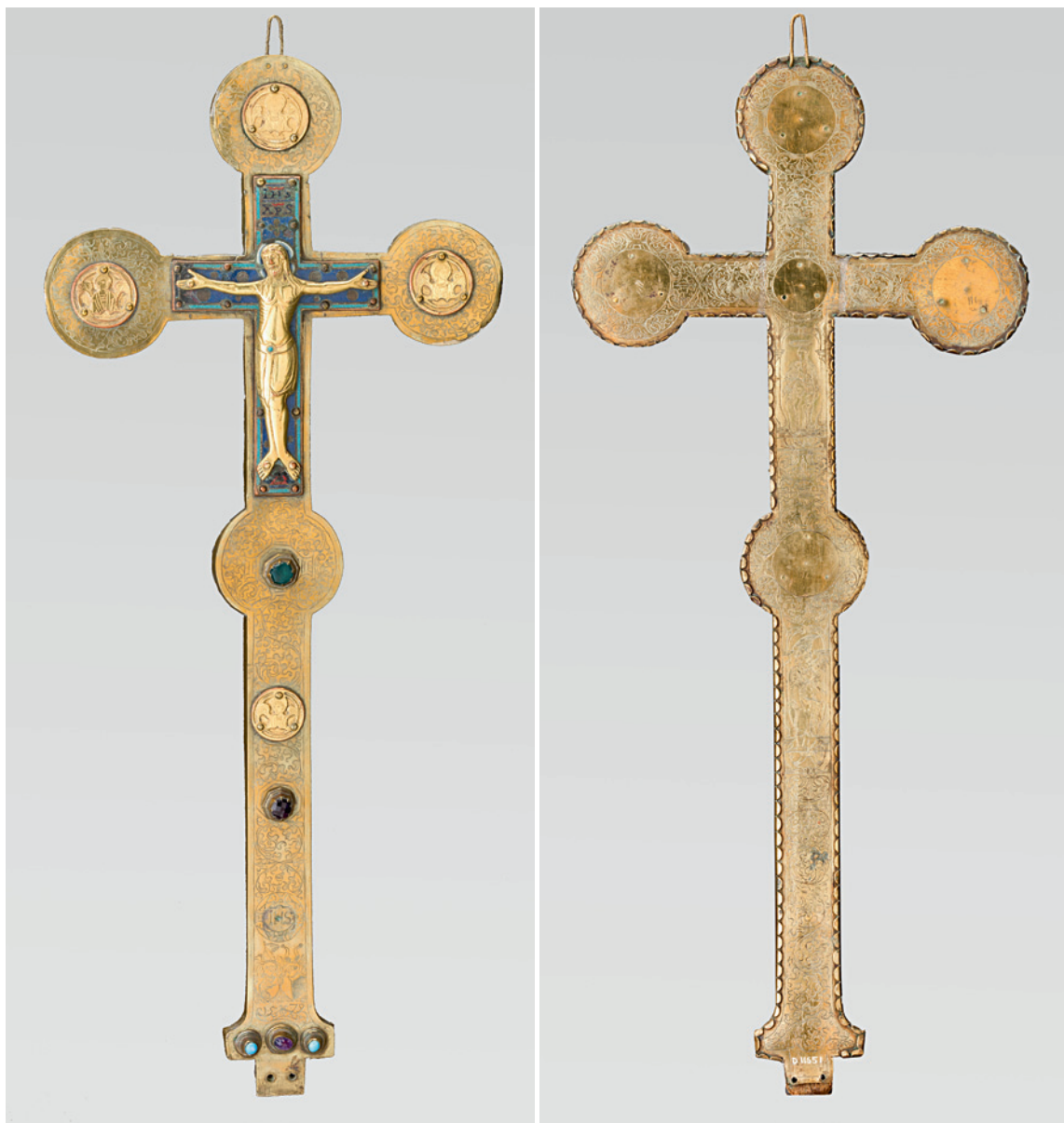
Fig. 3-4. Alterkrucifikset fra 1579. (s. 4475). 3. Forside. 4. Bagside. – Altar crucifix, 1579. 3. Front. 4. Back.