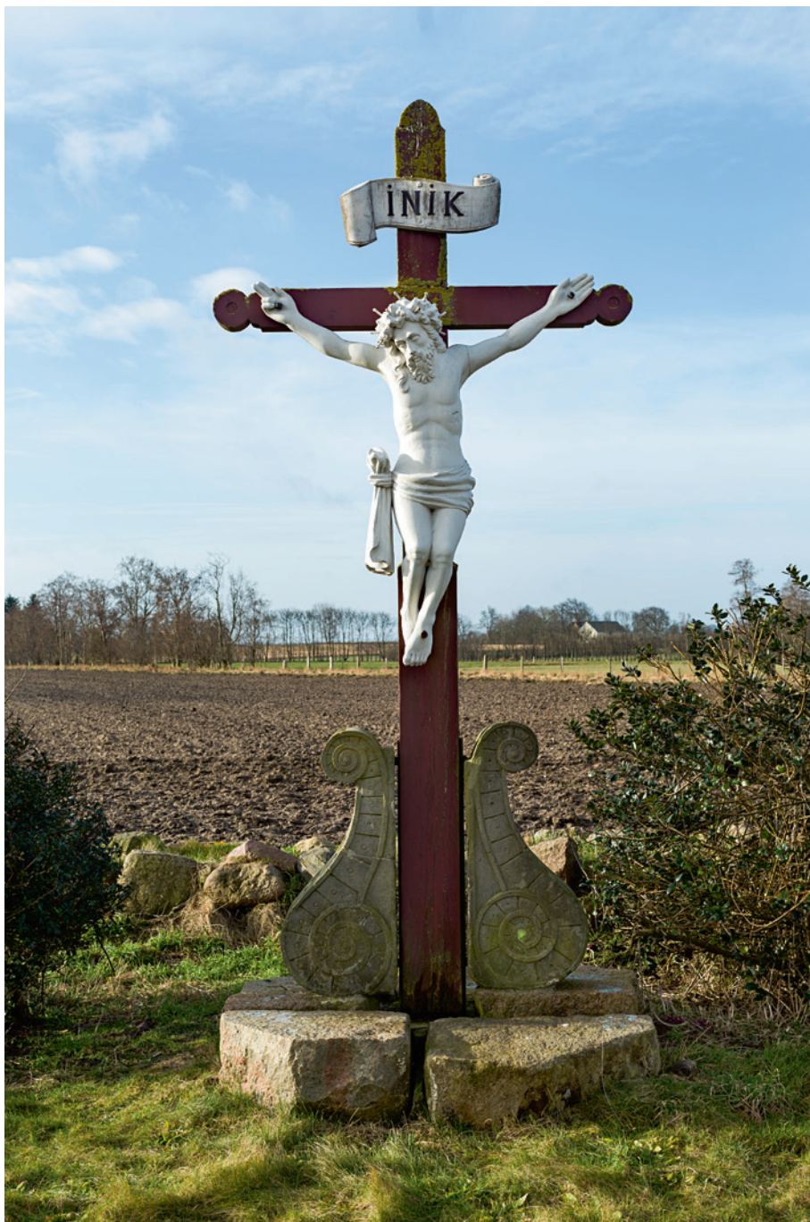
Fig. 9. Vejkrucifiks ved Skovsbovej (s. 4480). Foto Arnold Mikkelsen 2017. – Wayside cross by Skovsbovej.

synes dog at passe bedre på døtrene, enten Mette Hardenberg (†1629) eller Anne Hardenberg (†1625), der begge kæmpede med sindssyge. 17 En