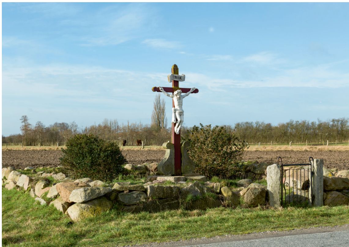
Fig. 8. Vejkrucifiks ved Skovsbovej (s. 4480). – Wayside cross by Skovsbovej.

Et *vejkrucifiks (fig. 8-9), der går tilbage til 1600-tallet, er opsat vest for herregården ved Skovsbovej og hegnes af et lavt, omtrent kvadratisk kampestensdige. Krucifiksets nuværende figur er skåret 2008 af Henrik Groth som en kopi efter en ældre *figur (jf. ndf.)