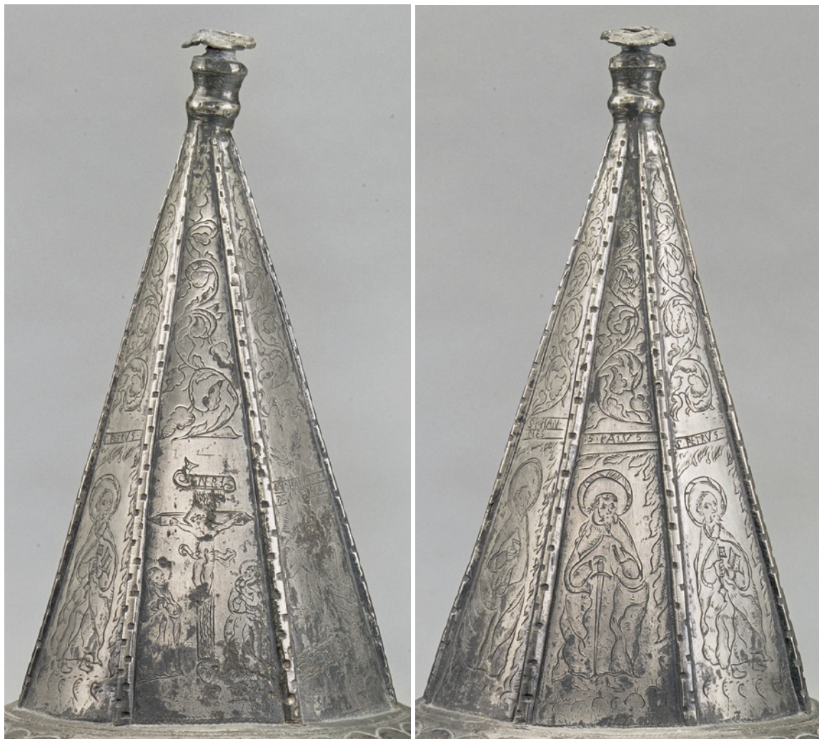
Fig. 10-11. Detaljer af tindøbefont, 1578 (s. 4478). 10. Korsfæstelsen. 11. Paulus. – Details of pewter baptismal font, 1578. 10. The Crucifixion. 11. Paul.