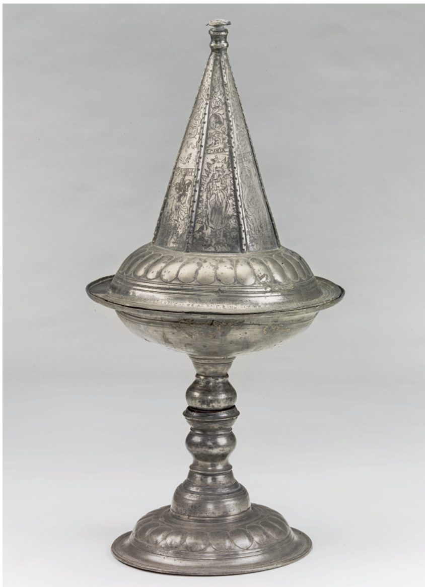
Fig. 7. Tindøbefont, 1578 (s. 4478). – Pewter baptismal font, 1578.

ter (fig. 11) samt af den himmelske Madonna stående på halvmånen og omkranset af en solgise. 12 Figurerne følges af versalindskrifter: »Johannes de doper«, »S. Bartelmves«, »S. Iohannes«, »S. Palvs« (sic), »S. Petrvs« og »S. Maria«, mens der langs lågets kant læses en delvist nedertysk indskrift, der citerer Joh. 3,16 og, afbrudt af et 16 cm langt manglende stykke, fortsætter med: » (...) haffe rhrcke har den berige oc frov Ane Rono [Anne