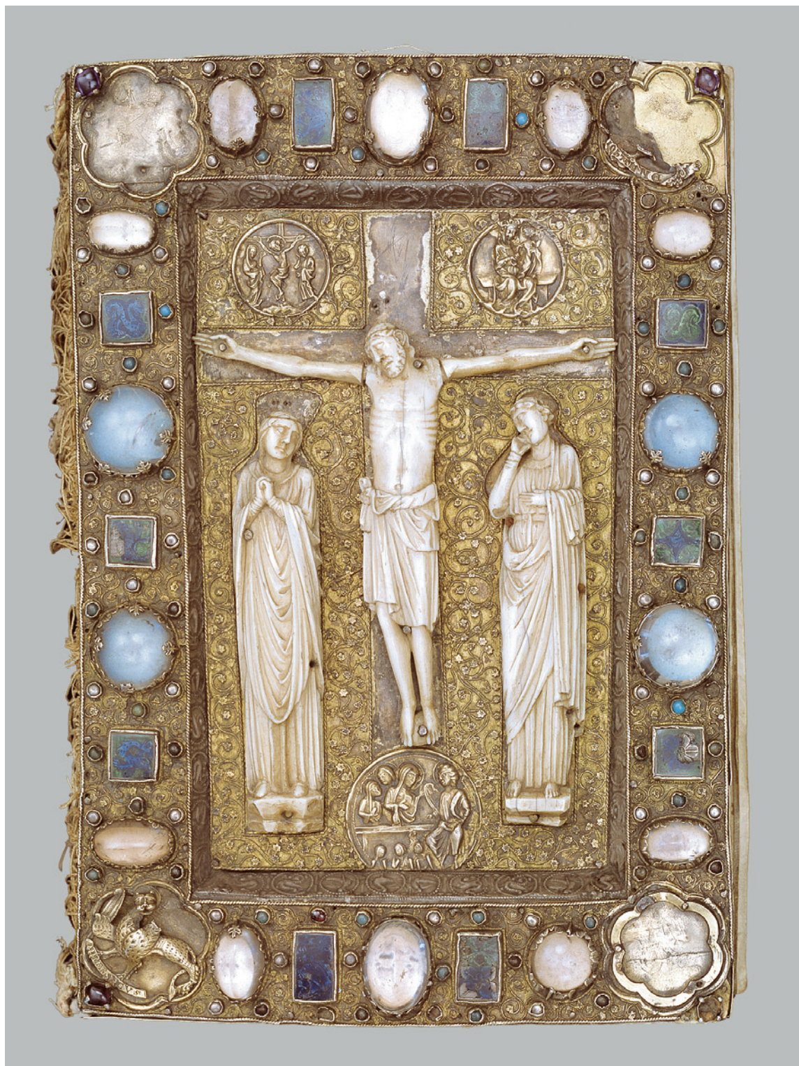
Fig. 5. Evangeliebog fra 1200-tallet, kaldet 'Hornebogen' (s. 4476). Foto Elin Lindhart Pedersen 2014. – Evangelary from the 13th century, called 'The Horne Book' .