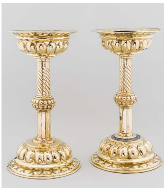
Fig. 23. Alterstager, o. 1875(?) (s. 5244). – Altar candlesticks c. 1875(?).