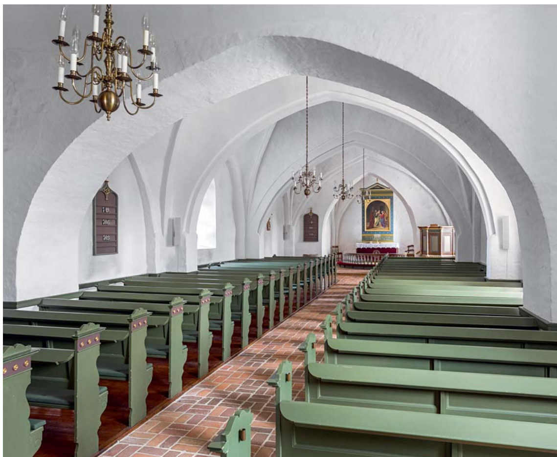
Fig. 17. Indre set mod øst. Foto Arnold Mikkelsen 2018. – The church interior looking east.

tet, stolestaderne ombygget og begge dele malet i lyse farver, formentlig en violettonet grå med forgyldninger, 33 der gjorde et »venligt og festligt« indtryk. 3 I forlængelse af omfattende arbejder på kirken 1937 blev restaureringen af korbuekrucifikset sat i værk, mens et kortæppe blev syet af sognets damer, og grevinde Jeromia Caroline Petersdorff skænkede en rød \dagger løber.