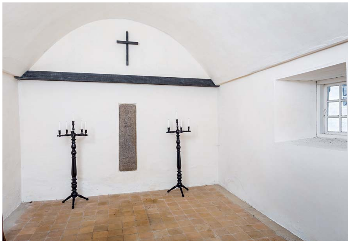
Fig. 11. Våbenhusets indre, nu ligkapel, set mod nord (s. 5230). Foto Arnold Mikkelsen 2018. – The interior of the porch, now a chapel, looking north.

Tårnrummet kom til at fungere som ny indgang til kirken. Der blev udført en høj vestportal med rundbuet stik, hvor der over døren er indsat et halvcirkulært vindue, en såkaldt lynette, som stikker op over tårnrummets loft og giver