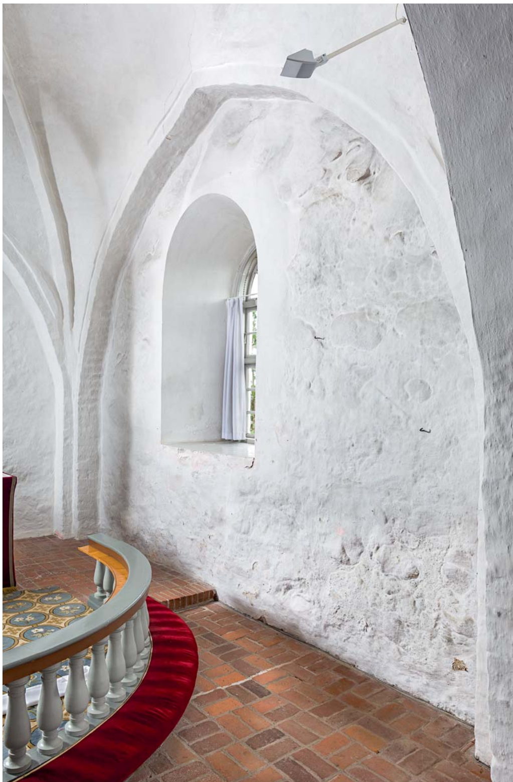
Fig. 14. Korets sydvæg (s. 5234). – The south wall of the chancel.