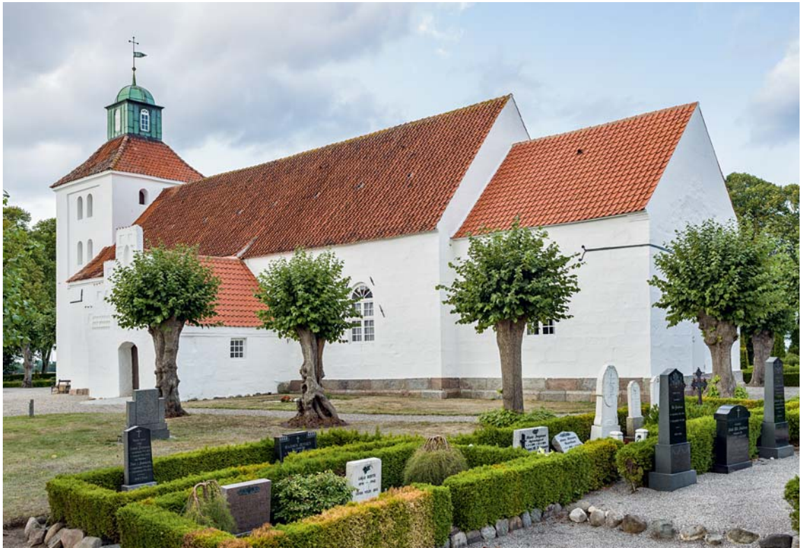
Fig. 4. Kirken set fra sydøst. – The church viewed from the south-east.