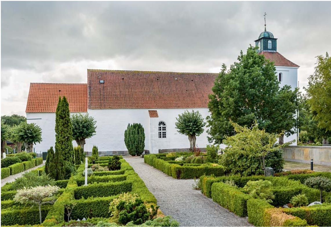
Fig. 5. Kirken set fra nord. Foto Arnold Mikkelsen 2018. – The church seen from the north.

Ingen af de oprindelige vinduer er i brug, men der er spor efter flere. Et blændet vindue øjnes midt på korets østgavl, hvor sålbænken og mu-