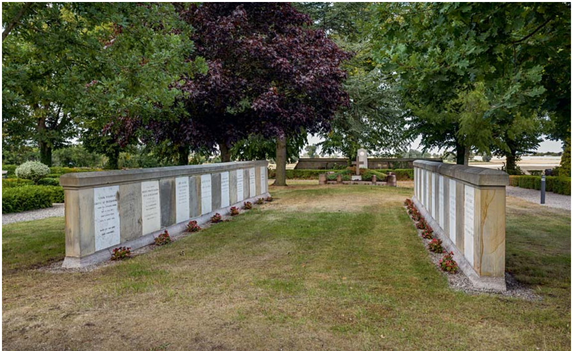
Fig. 33. Grevskabet Roepstorffs familiebegravelse, 1913 (s. 5251). – The Roepstorff family burial, 1913.

Nedenfor er anført en oversigt over trykte og utrykte kilder og litteratur anvendt i beskrivelsen af Krogsbølle Kirke. For en oversigt over arkivalier og litteratur samt forkortelser anvendt i Odense Amt i almindelighed jf. også s. 52–54 samt 56–59. Henvisninger til Danmarks Kirker , Kbh. 1933–, er angivet som DK , efterfulgt af betegnelsen for pågældende amt; referencer inden for Odense Amt har dog kun sideangivelse.