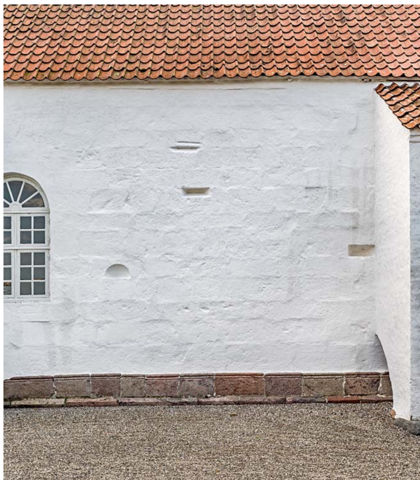
Fig. 9. Skibets nordmur med omsatte kvadre (s. 5228). Foto Arnold Mikkelsen 2018. – The north wall of the nave with added blocks.

I det indre oplyses tårnrummet nu af et nyere vindue i syd (jf. s. 5232), men den oprindelige lyskilde til bygningsafsnittet var givetvis et vindue i \uparrow vest, som i facaden var anbragt i et spidsbuet spejl. Resterne af dette spejl kan nu iagttages fra det nye tårns nedre mellemstokværk. Det gamle tårnrum overdækkes af et gipset bræddeloft med en bred skråkant, der er lagt en smule højere end det flade bjælkeloft, som tårnet blev opført med.