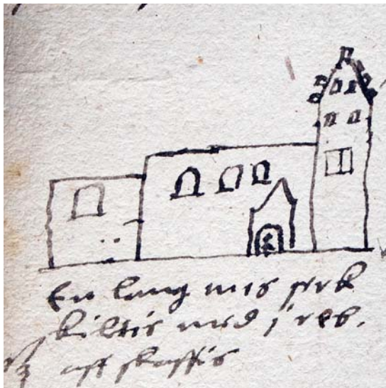
Fig. 35. Skitse af kirken i biskop Jacob Madsens visitatsbog. I RAO. – Sketch of the church in Bishop Jacob Madsen's book of visitations.