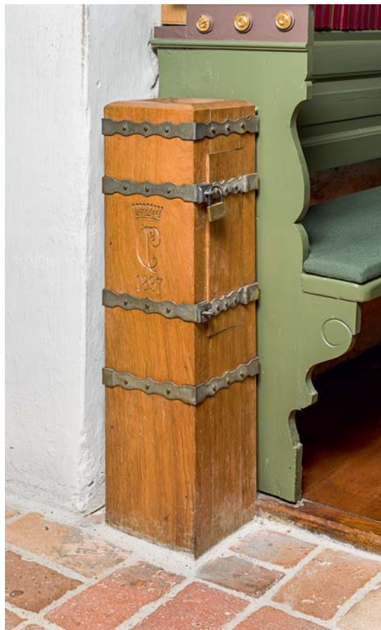
Fig. 29. Pengeblok, 1887 med grevskabet Petersdorffs monogram (s. 5248). – Money box, 1887, with Petersdorff monogram.

2) 1821, støbt af Gamst, København; 68 cm i diameter. Klokken har en versalindskrift om halsen: »Støbt af I. C. & H. Gamst Kiøbenhavn 1821«, og over denne løber en bort af planteornamentik. Overgangen til slagringen er markeret af to profilringe. Ophængt i en vuggebom udført 1933 af August Nielsen sydligt i tårnets klokkestokværk.