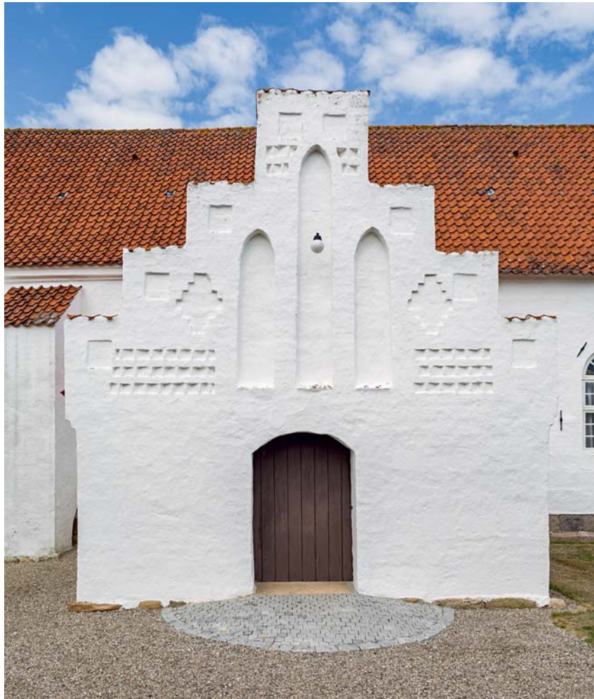
Fig. 10. Våbenhusets sydgavl (s. 5230). Foto Arnold Mikkelsen 2018. – The south end wall of the porch.

fag samt på skjoldbuerne i skibets tredje fag, der er mindre end de to andre. Alle hvælvkapperne i koret og skibet er blevet udstyret med indtil flere sekundære ophængningshuller. Skibets gjordbuer er blevet undermuret, og pillerne er blevet forstærket. Hvornår dette udførtes, er uklart, men det kunne meget vel være sket i 1830'erne (jf. s. 5232).