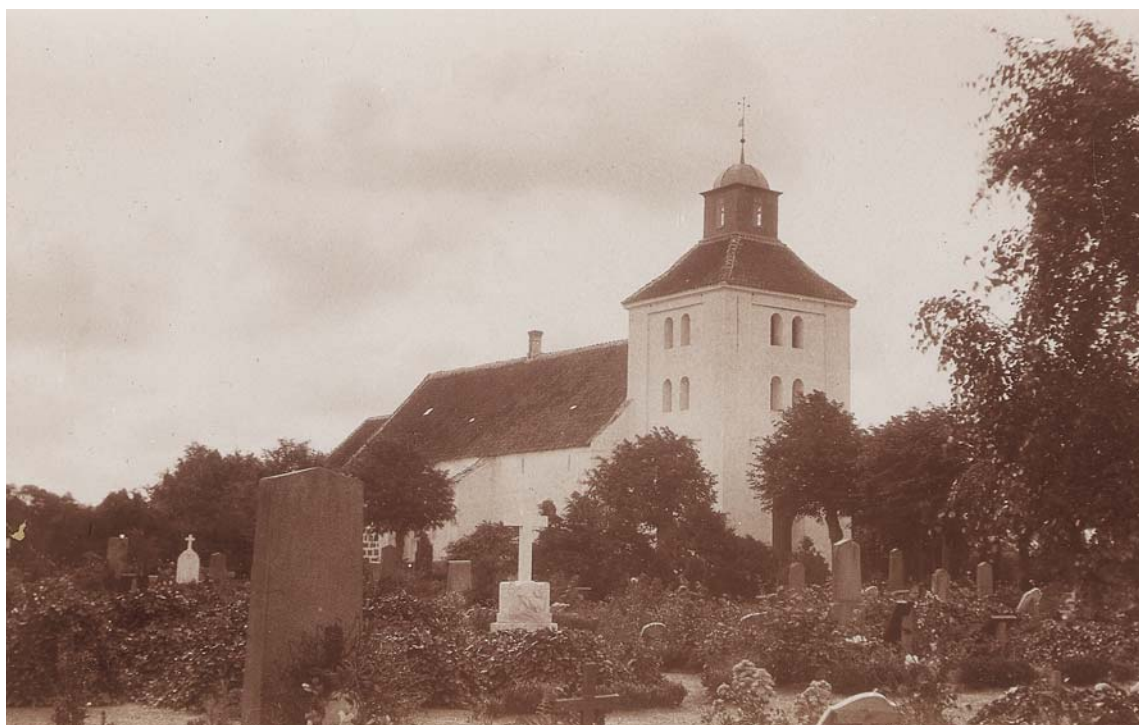
Fig. 34. Kirken set fra nordvest. Foto fra begyndelsen af 1900-tallet. – The church seen from the north-west.

Arkivalier. Rigsarkivet, Odense (RAO). Topografica : Fyn i almindelighed. Udskrift af præsteindberetninger 1706–07 ( Topografica . Præsteindb. 1706–07.). Bispearkivet : Skam Herreds Breve 1562–1785 ( Bispeark . Skam Herreds breve) – Synsforretninger og andre indberetninger 1631–1702, med uddrag af regnskaber 1631–35 ( Bispeark . Synsforretn.) – Indberetninger om kirkernes tilstand og indkomst 1664–78 ( Bispeark . Indb om kirkernes tilstand) – Indberetninger om kirker og kirkegårde 1812–30 og 1832–43 ( Bispeark . Indb. kirker og kirkegårde) – Synsforretninger over kirker og præstegårde 1872–81 og 1882–98 ( Bispeark . Synsforretn. kirker og præstegårde). Provstiarkiver . Odense provsti: Korrespondance angående Lunde, Skam og Skovby herreder 1812–16 og 1834–37 ( Provstiark . Korresp. ang. Lunde, Skam og Skovby herreder) – Lunde, Skam og Skovby herredsprovsti: Kirkesyn 1924–49 ( Provstiark . Kirkesyn) – Bogense provsti: Synsprotokol 1904–2000 ( Provstiark . Synsprot) – Pastoratsarkivet : Embedsbog 1846–1949 ( Pastoratsark . Embedsbog) – Synsprotokol 1844–1922 ( Pastoratsark . Synsprot.). Menighedsrådsarkivet : Forhandlingsprotokol 1904–86 ( Menighedsrådsark . Forhandlingsprot.). Grevskabet Roepstorffs arkiv . Dokumenter vedrørende kirkerne 1567–1834 ( Grevskabet Roepstorff ark . Dok. vedr. kirkerne).