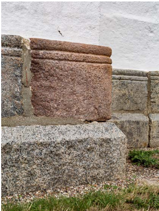
Fig. 7. Skibets sokkel (s. 5226). – The plinth in the nave.

En række senmiddelalderlige ændringer og tilføjelser , alle i munkesten, er udført ved kirken i løbet af 1400-tallet; forandringernes rækkefølge kan dog ikke endegyldigt fastlægges. Først blev et tårn sluttet til skibets vestende. Dernæst blev der indbygget hvælv i koret og skibet. Endelig rejste man et våbenhus ud for skibets syddør i årene op til reformationen.