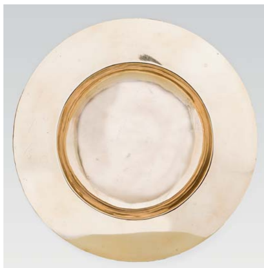
Fig. 25. Dåbsfad, o. 1850 (s. 5245). Foto Arnold Mikelsen 2018. – Baptismal dish, c. 1850 .

Korbuekrucifiks (fig. 26), o. 1475–1500. Den 94 cm høje Kristusfigur hænger i strakte, omtrent vandrette arme med hænderne krummet om naglerne. Hans hoved duver mod højre skulder og modsvares af hoftens forskydning mod venstre. Benene er næsten parallelle med højre fod lagt over den venstre. Den store tornekrone med kraftige torne hviler over det lange, krøllede hår, der hænger ned på hver skulder. Ansigtet er margert med en lang næseryg, næsten lukkede øjne, halvåben mund med fremskudt tunge og et stort, krøllet skæg. Ribbenene er tydeligt markerede på den spinkle krop og fortsætter helt ned til taljen. Fra såret i den højre side flyder en stor og forbløffende velbevaret blodklase. Lændeklædet hænger med skarpe folder om hofterne og har midt- og sidesnip.