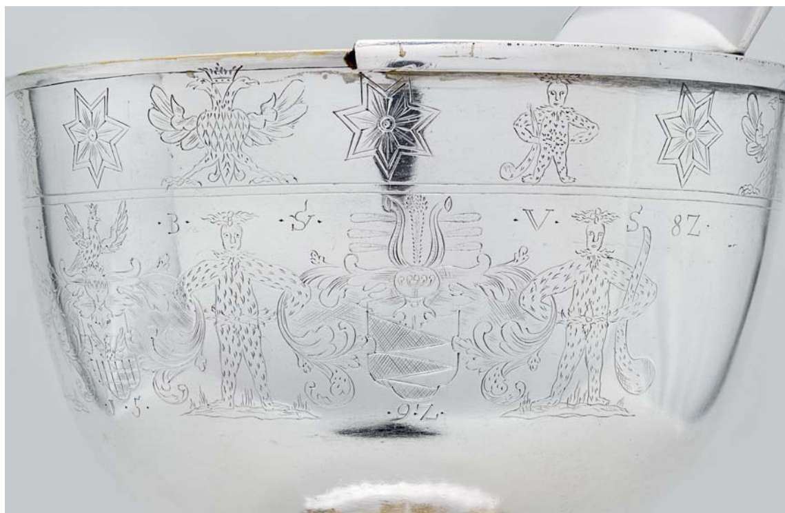
Fig. 36. Detalje af alterkalkens bæger (s. 5242). – Detail of chalice.