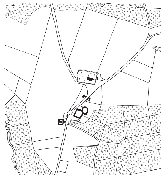
Fig. 3. Matrikelkort. 1:10.000. Målt af J. J. Bærner 1783-84. Tegnet af Freerk Oldenburger 2019. – Cadastral map.

1905 ønskede man at indrette et †toilet på kirkegården, men det blev muligvis ikke realiseret, for otte år senere blev der på et offentligt møde i kirken henstillet til, at der blev opført et toilet på kirkegården. 17 O. 1964 opførtes et †redskabshus , og få år senere opførtes nye toiletter. 17