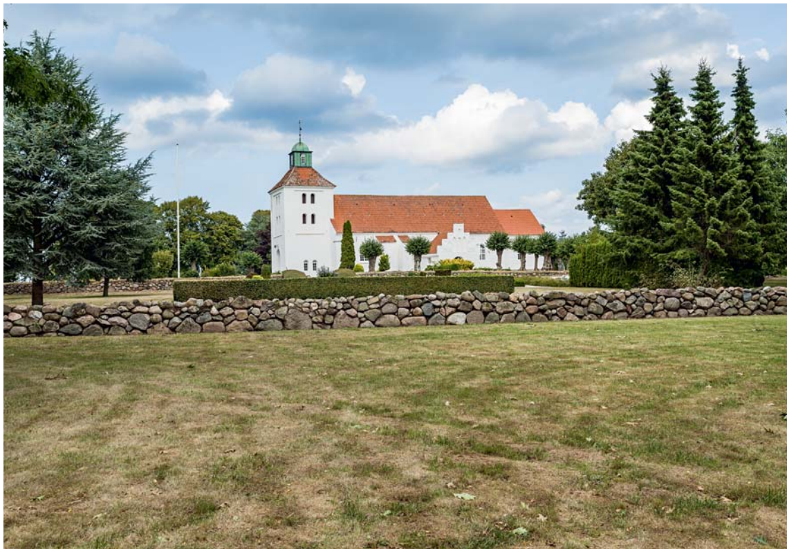
Fig. 1. Kirkens omgivelser. Foto Arnold Mikkelsen 2018. – The area surrounding the church.