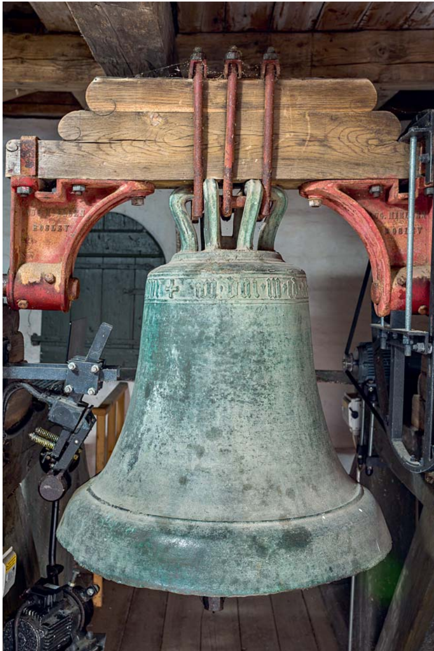
Fig. 30. Klokke, oprindeligt støbt 1420 til Jerne Kirke (s. 5249). Foto Arnold Mikelsen 2018. – Bell, originally cast in 1420 for Jerne Church.