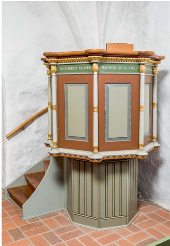
Fig. 27. Prædikestol, 1841 (s. 5247). – Pulpit, 1841 .

Pengeblokke . 1) (Fig. 29), 1897, af eg, 21×21 cm, 83 cm høj. Den er skænket af grevskabet Petersdorff, hvis kronede og sammenslyngede monogram er skåret i fronten: »GP/ 1897«. Blokken er omvundet af fire dekorativt udformede jernbånd, hvoraf de to dækker for en låge i siden og kan sikres med hængelåse. Opstillet i skibet ved