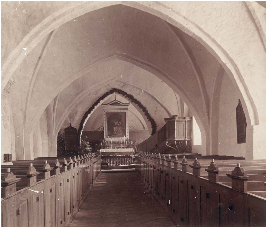
Fig. 16. Kirkens indre set mod øst. Foto før 1910. – The church interior looking east.