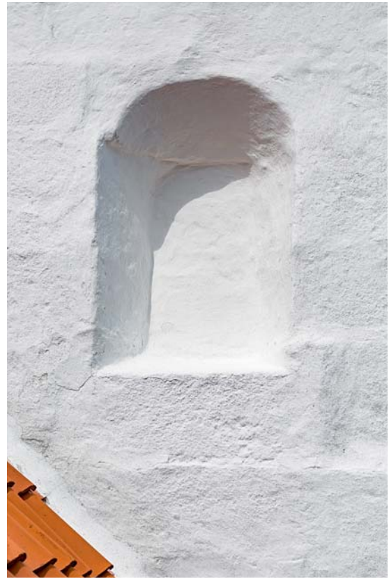
Fig. 8. Blændet, romansk vindue (s. 5228). – Bricked-up Romanesque window.

Et (†)tårn blev opført ved skibets vestgavl. Tårnet, der 1836 stort set er kortet ned til skibets gesimshøjde (jf. s. 5231), er jævnbredt med skibet. Bygningen har ikke nogen synlig sokkel, men hviler i facaden på tre skifter af genanvendte granitkvadre fra den gamle vestgavl. Endvidere er skibets vestre hjørnekvadre blevet flyttet med ud i tårnets vestre hjørner. Øverst på tårnets nordfacade er der også brugt kvadre indlagt i et prydbælte et stykke under etageadskillelsen mellem tårnrum og mellemstokværk. Mod vest har tårnets facade været udsmykket med en række (†) murblændinger, formentlig udformet som tre stigende, lancetformede blændinger, hvoraf resterne nu kan erkendes fra det nye tårns nedre mellemstokværk (jf. s. 5232). Det kan ikke udelukkes, at disse blændinger også kunne stamme fra en midlertidig vestgavl, muret før resten af tårnet blev opført.