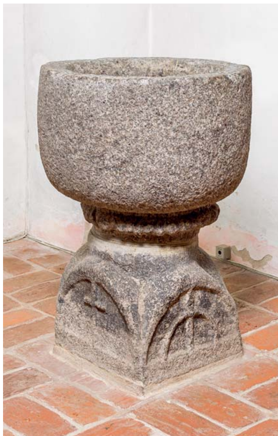
Fig. 24. Døbefont, romansk (s. 5244). – Font, Romanesque .

†Korsranke , nævnt 1665, da låsen for 'kordøren' skulle repareres. 7