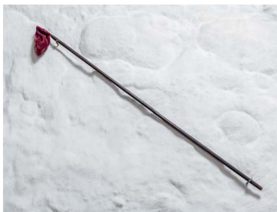
Fig. 28. Klingpung, 1800/50 (s. 5248). – Offertory, 1800/50.

Tavle , o. 1875, 55×34 cm, sortmalet med skrift i hvid kursiv: »Tobaksrygning i Kirken forbydes!«. Ophængt på tårnloftet. Tilsvarende tavler i Nørre Nærá og Bederslev (s. 5300 og 5325).