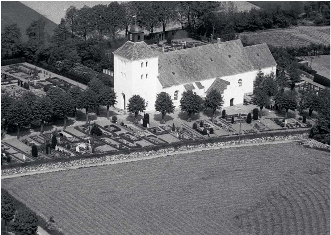
Fig. 2. Kirken og dens omgivelser. – The church and its surroundings.

†Trefoldighedskirken skulle betjene den sydlige del og det gamle Hundstrup Sogn. Det var ligeledes udfordringerne i Agernæs Sogn, der dels var gennemskåret af en fjord, dels havde en forfalden sognekirke (s. 5260), som var årsagen til, at de to sogne 1787 blev lagt sammen, idet man opgav at reparere Agernæs sognekirke (†Trefoldighedskirken) og i stedet havde udvidet Krogsbølle, så den kunne huse det sammenlagte sogns befolkning. 13