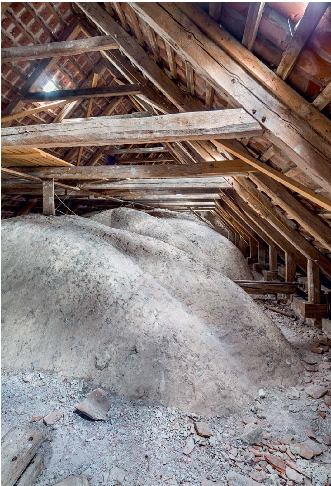
Fig. 15. Skibets hvælv set fra loftet (s. 5229). – The nave's vault seen from the loft.