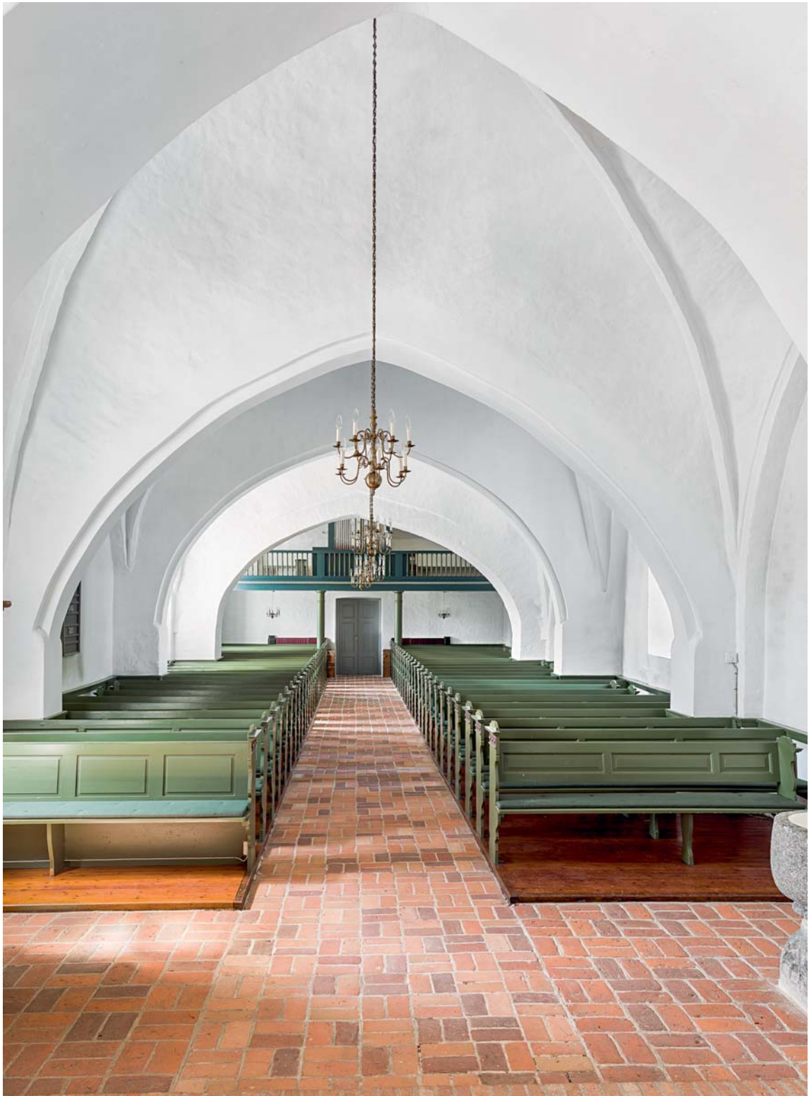
Fig. 13. Indre set mod vest. Foto Arnold Mikkelsen 2018. – The interior looking west.