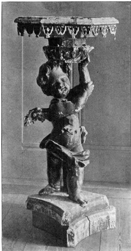
C. A. J. 1918