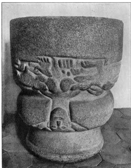
V. H. 1929