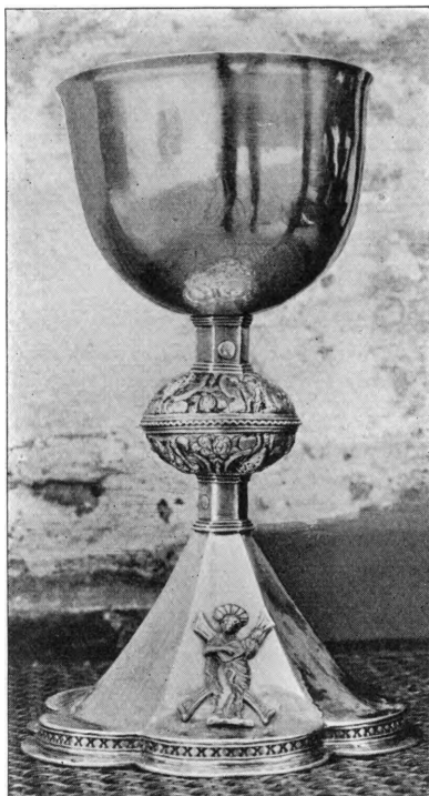
P. N. 1916

Font , af Granit, romansk (Fig. 4), af een Sten. Den høje Kummens glatte Sider er stejle, med bred Rundstav over Foden; paa den nedre Del og strækkende sig ned over Rundstaven findes et Relief, der ikke hæver sig over Fontens Yderflader og som besynderligt nok staar paa Hovedet. Det forestiller »Luxuria« (Yppigheden) en Kvinde, der bærer volutsvungne Horn, og hvis Hæn-