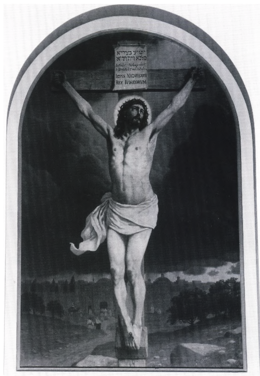
Fig. 5. Altertavlemaleri, o. 1910, af maleren og bogillustratoren Poul Steffensen (s. 2360). – Altargemälde von dem Maler und Zeichner Poul Steffensen, um 1910.

Salmenummertavler . 1) En af oprindelig fire fra kirkens opførelse. Sortmalet tavle, 75×43 cm, af tre egeplanker, med svungen overkant. Til kridt. På kirkeloftet. 2-6) Nyere. Rektangulære, hvidmalede tavler, 63×50 cm, med grå ramme, hvoraf en, med »Daab« og »Nadver«, er todelt af grå tværliste. Ophæng til sorte letmetalcifre. I skibet. Til belysning tjener tre 16-armede lysekroner af messing. 1) 1918, med otte store og otte små arme, otte pyntearme med klokkeblomst og hængekugle med graveret kursivindskrift »Skænket af Bertel Sørensen og Hustru Vesterhede 1918«. Ophængt i sort jernstang med kugler, i koret. 2-3) 1980. I enkle former. Ophæng som nr. 1, i skibet. Fire (†) lysekroner og en (†) lysearm , til petroleum, af forgyldt jern. På kirkeloftet.