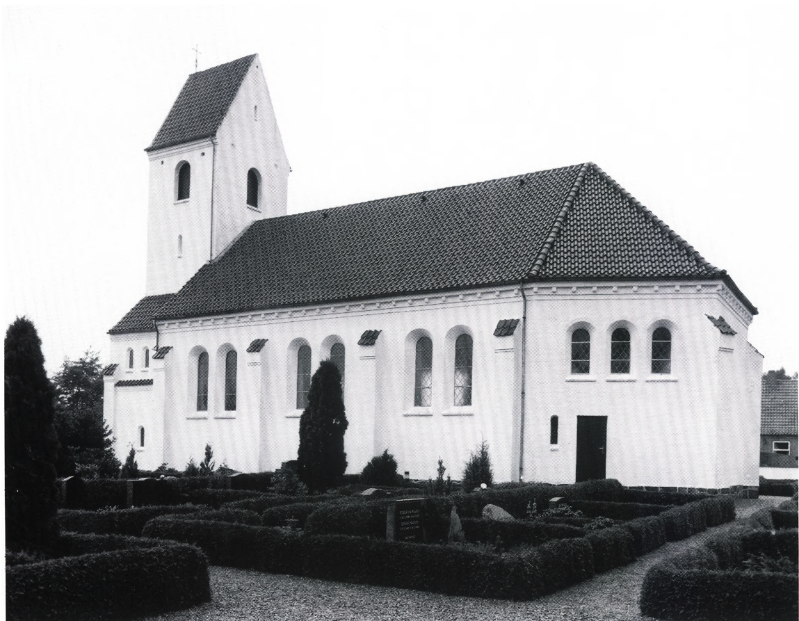
Fig. 2. Kirken set fra sydøst. NE fot. 1990. – Südostansicht der Kirche.

Indgangsportalen i vest, med rundbuet vindue, indrammes af en trekantgavl med kragbånd. Herover er et cirkulært vindue med glasmosaik, Flugten til Ægypten, holdt i blå, rødt, gult og brunt og skænket af en beboer i sognet, 1 samt et lille vindue i et muret malteser-kors.