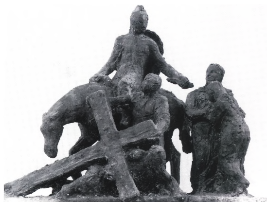
Fig. 4. Alterprydelse, Korsegangen, fra 1961. Bronzeskulptur udført af Mogens Bøggild (s. 2360). – Altarzier, die Kreuztragung, von Mogens Bøggild 1961.

Redaktion ved Vibeke Andersson Møller og Ole Olesen (orgler) 1991. -