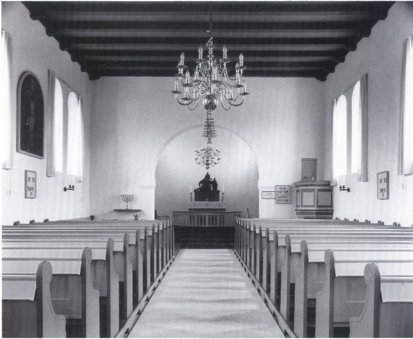
Fig. 3. Indre set mod øst. – Innenansicht gegen Osten.