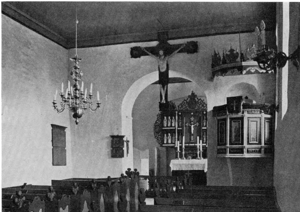
Fig. 3. Højrup. Indre, set mod øst.