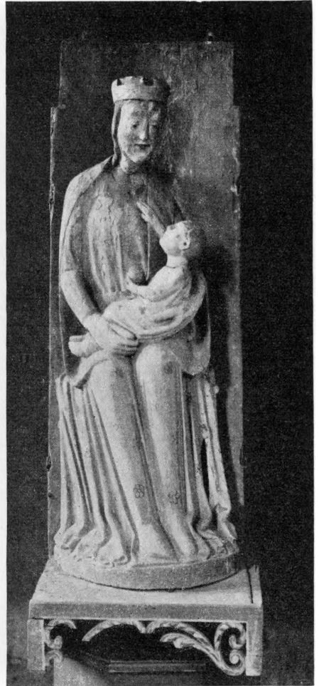
Fig. 4—5. Højrup. 4. *Kristus som

verdensdommer; fra altertavlens midtskab (p. 1198). 5. *Maria med barnet; sidealtertavle (p. 1200).