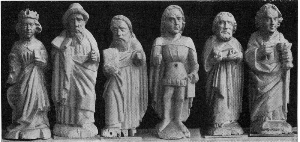
Fig. 6 a—f. Højrup. Figurer fra altertavlen (p. 1198).