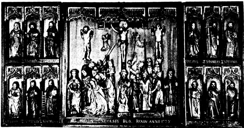
Fig. 1. Rise. *Altertavle (p. 1811).