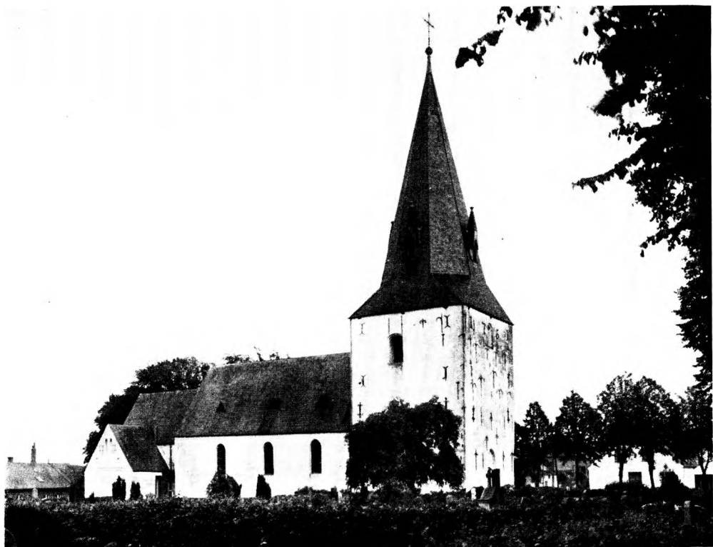
Fig. 1. Rise. Ydre, set fra nordvest.