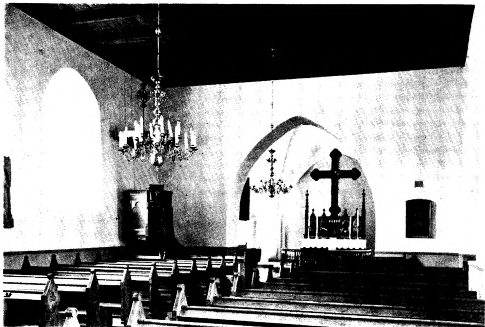
Fig. 3. Rise. Indre, set mod øst.