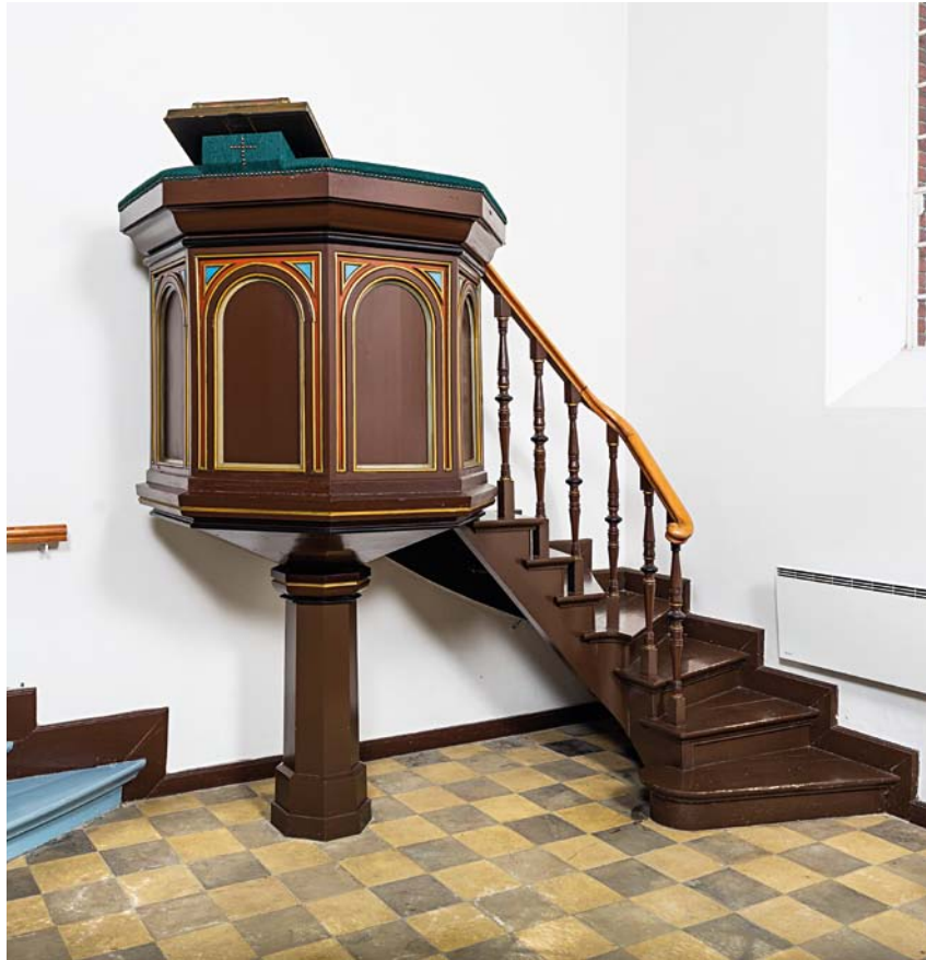
Fig. 11. Prædikestol, 1883 (s. 1338). – Pulpit , 1883.

Syvstage , formentlig o. 1900, udført af Kgl. Hofbronzestøber Lauritz Rasmussen; en såkaldt Titusstage.