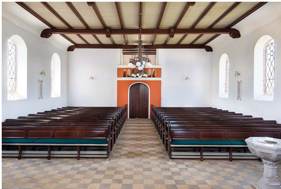
Fig. 12. Indre set mod vest. – Interior looking west.

En servante , 1883, leveret af snedker A. Andersen, 27 malet med lys egetræsådring og med plade af sort/hvid marmor, opbevares i rummet nord for orglet.