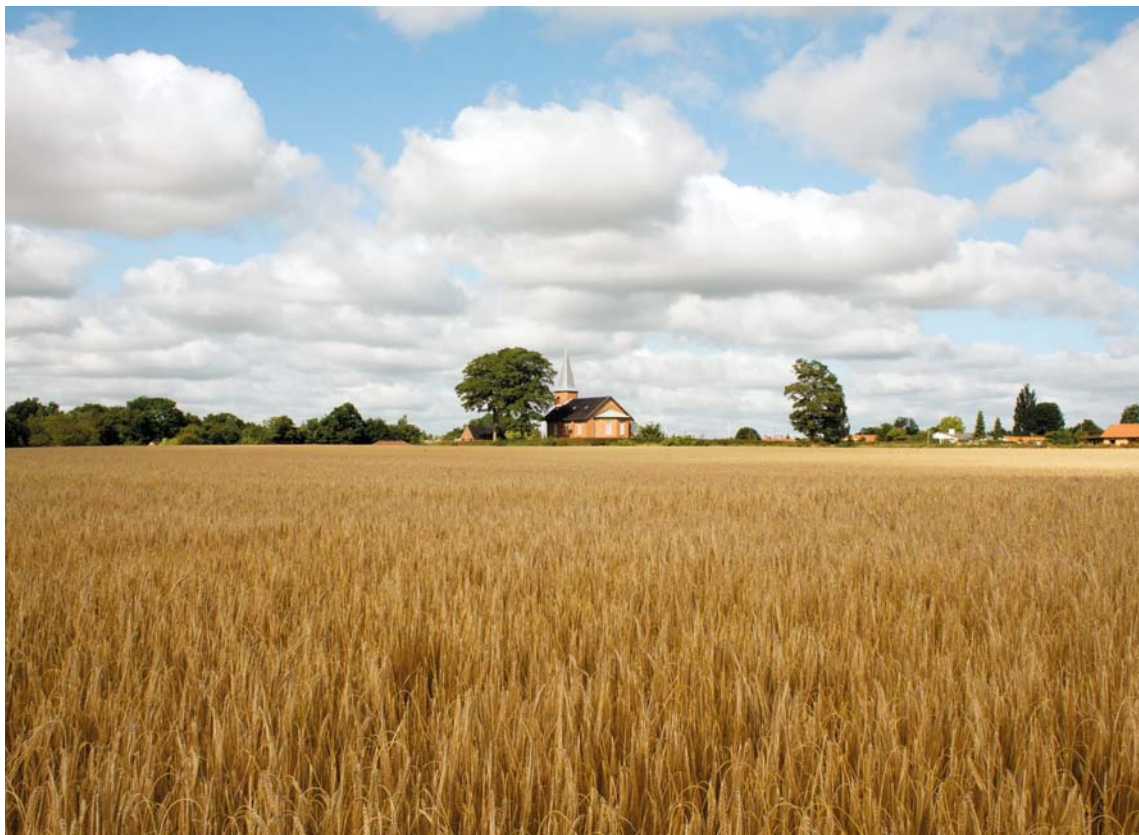
Fig. 2. Kirken set fra nordøst. Foto Kirstin Eliassen 2015. – Church seen from the north east.