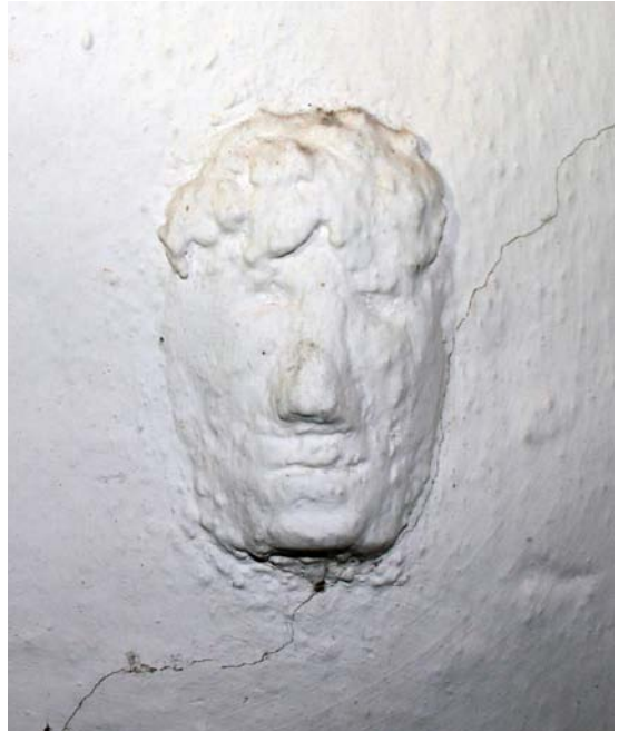
Fig. 15. Mørtelrelief i tårnets klokkestokværk (s. 1334). Foto Kirstin Eliassen 2015. – Mortar relief in the tower.

udført efter medfølgende, skitserede tegning') og 23. juni 1876 ('overslag på en døbefont efter opgiven tegning'), lydende på hhv. 580 og 1650 kr., dels et overslag fra billedhugger C. J. Rosenfalk 17. juni 1876 på 'en døbefont ... efter leveret tegning', lydende på 1995 kr.; RA. Tvede. Emneordn.ark. Af kirkens synsprotokol fremgår endvidere, at man i juli 1875 ville anskaffe en døbefont hos billedhugger Evens til 580 kr., jf. LAFyn. Pastoratsark. Kirkeprot. Det må være denne notits, der har givet anledning til misforståelsen omkring døbefontens mester.