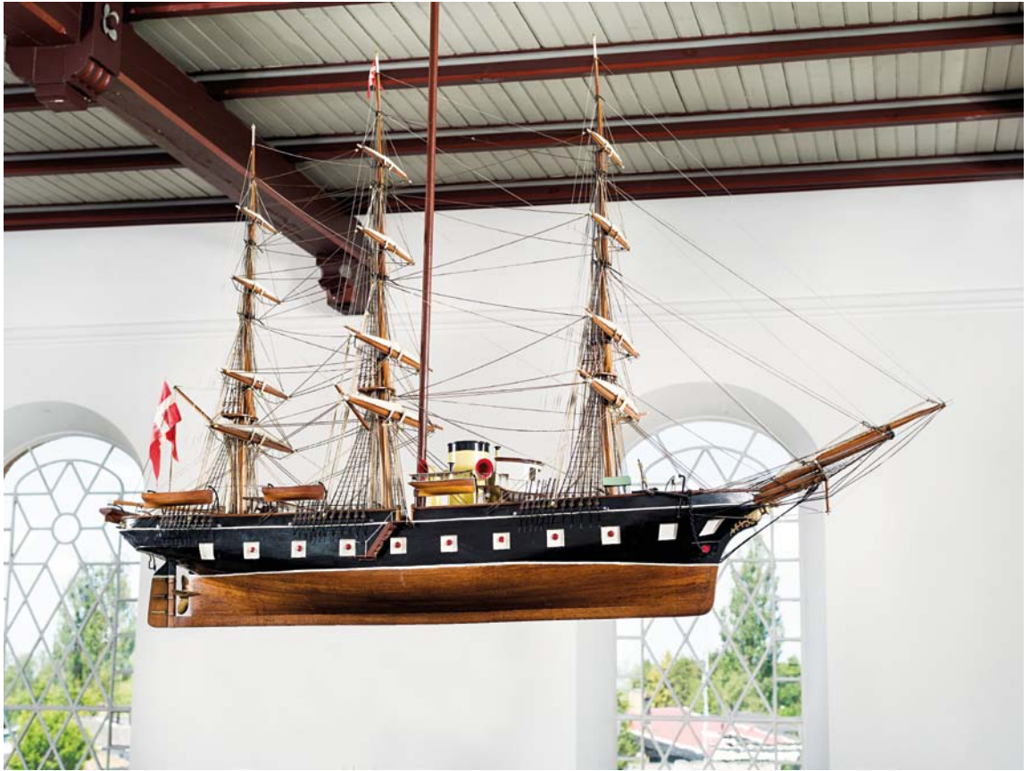
Fig. 13. Kirkeskib, ophængt 1922, bygget af Oswald Clausen, Nyborg (s. 1341). – Church ship, hung up in 1922, built by Oswald Clausen, Nyborg.

Pengeblok , 1883, leveret af tømrermester Aug. Colding. 20 Af træ, beslået med fire vandrette jernbånd samt to jernbånd med overfaldslukke på låget, lukket med to moderne hængelåse. Øverst pengerille. Rødmalet med forsøvede beslag. Oprindelig egetræsmalet. 20 I våbenhuset.