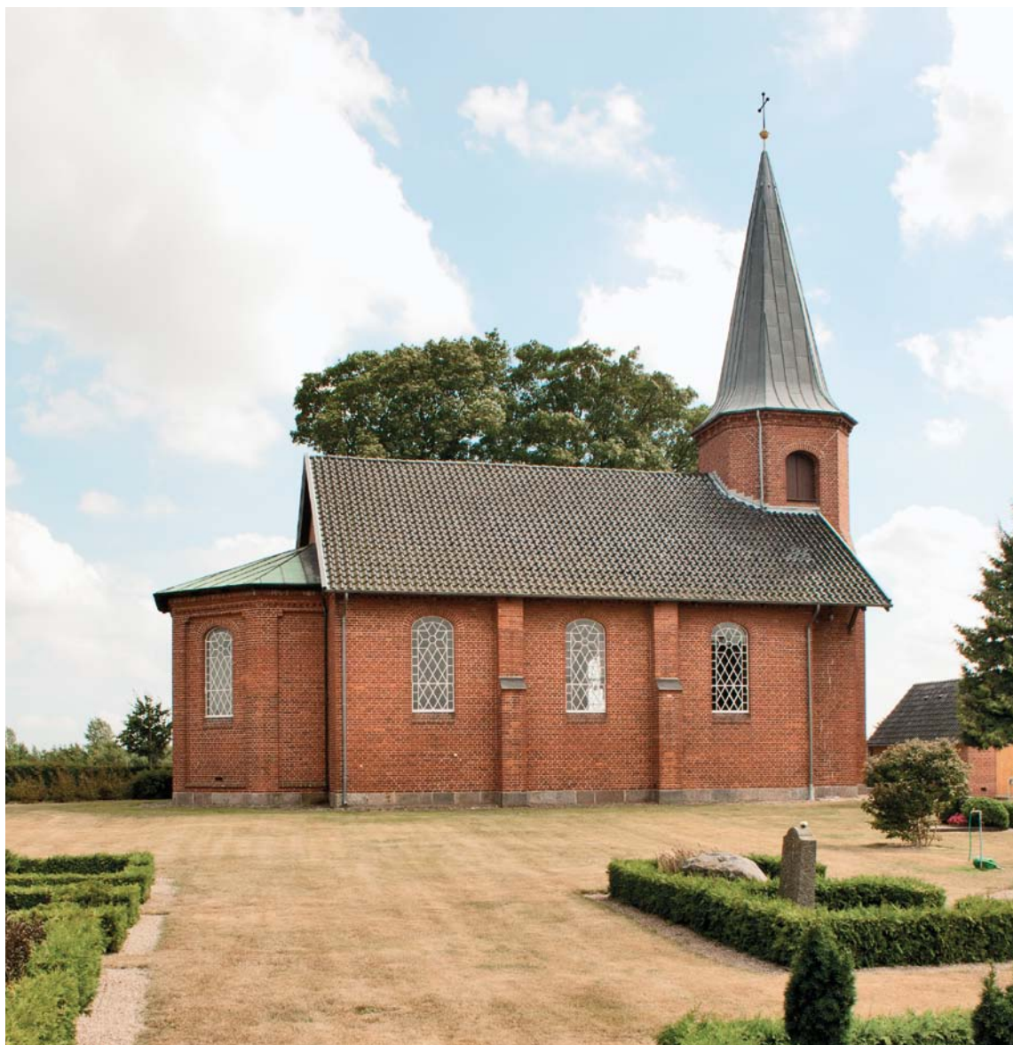
Fig. 6. Kirken set fra nord. – Church seen from the north.

I klokkestokværket findes et mørtelrelief (fig. 15), forestillende et mandsansigt, udført i opmu-