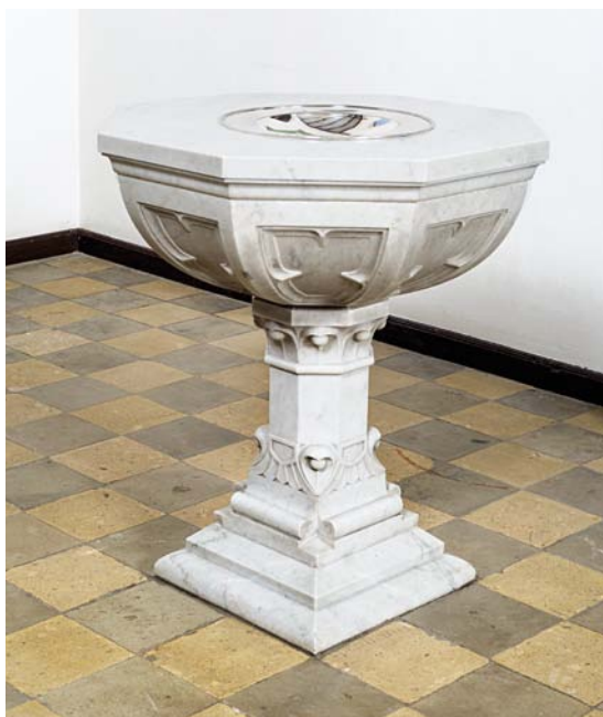
Fig. 9. Døbefont, 1876, udført af billedhugger Niels Herman Bondrup efter tegning af arkitekt V. Tvede (s. 1338). Foto Arnold Mikkelsen 2014. – Font , 1876, by sculptor Niels Herman Bondrup to a drawing by architect V. Tvede.

Oblatæskan , nyere, 8,8 cm i tværmål, er glat med let hvælvet låg. Under bunden et stempel: »TF 925S« for firmaet Fredberg.