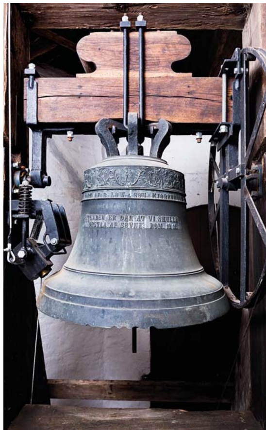
Fig. 14. Klokke, 1883, støbt af B. Løw & Søn (s. 1341). – Bell, 1883, founded by B. Løw & Søn.

Landsarkivet for Fyn (LAFyn). Fyns Stiftsovrighedsarkiv : Nyborg Kirkes regnskaber 1881-1901 ( Stiftsovr.ark. Rgsk.). Nyborg Kirkeinspektionsarkiv : Nyborg Kirkes regnskaber 1837-1910 ( Kirkeinsp.ark. Rgsk.). – Kirkeprotokol 1862-1910 ( Kirkeinsp.ark. Kirkeprot.). Nyborg Pastoratsarkiv : Kirkeprotokol for Hjulby Kirke 1871-1959 ( Pastoratsark. Kirkeprot.). Menighedsrådsarkivet: Sager vedr. kirken 1883-1961 ( Menighedsrådsark. Sager vedr. kirken). – Kassebog 1908-1923 ( Menighedsrådsark. Kassebog). – Kirkeregnskabsbog 1911-45 ( Menighedsrådsark. Rgsk.). Den kgl. Bygningsinspektør : Sager vedr. kirkebygninger på Fyn 1896-1915 ( KglBygnInspe. Kirker på Fyn).