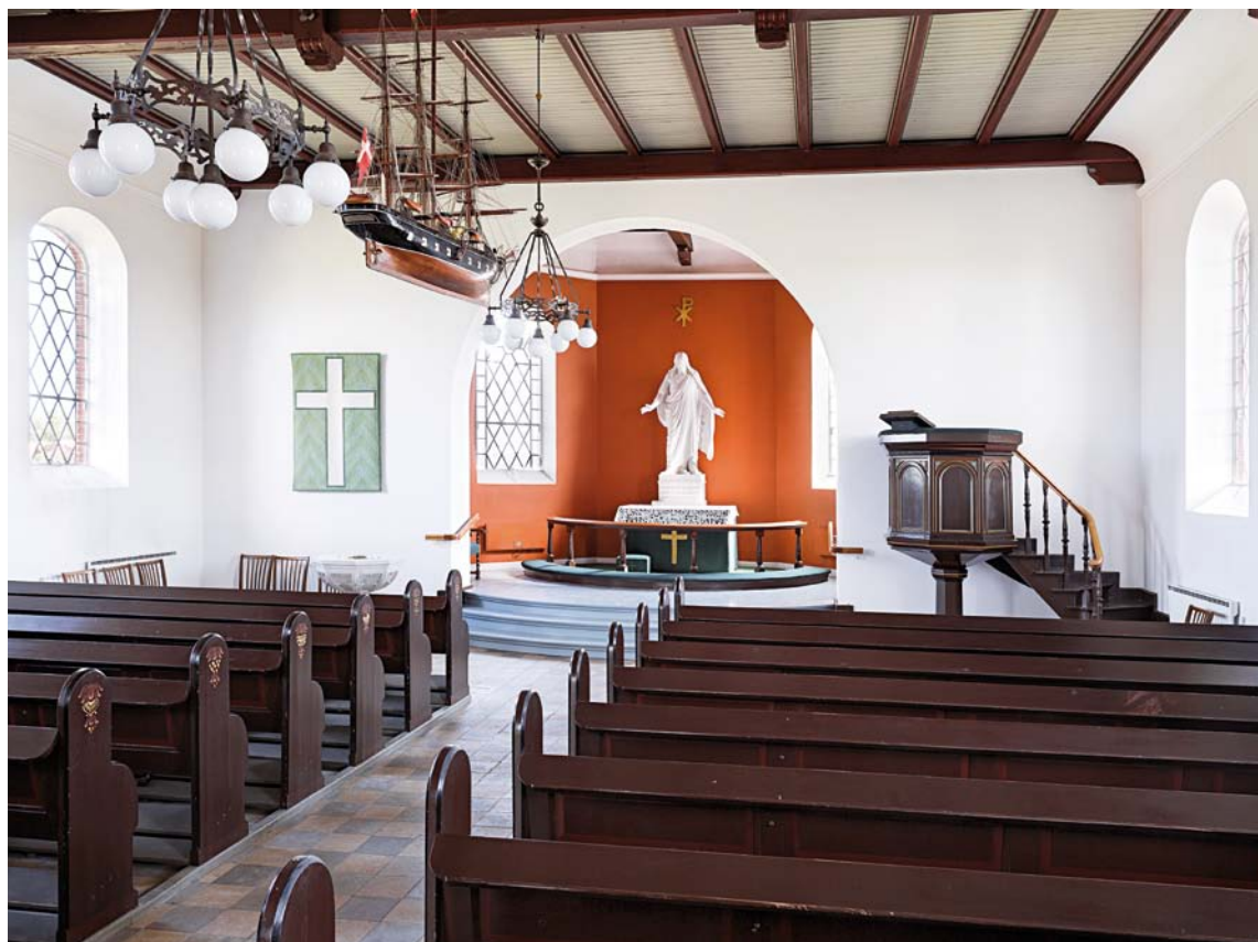
Fig. 7. Indre set mod øst. Foto Arnold Mikkelsen 2014. – Interior looking east.

ringsmørtel. Relieffet er formentlig udført af en håndværker, men er ikke dateret. Lignende relieffer, hvoraf de ældste er dateret til slutningen af 1800-tallet, findes i store mængder i Nyborg Vor Frue Kirke (s. 934 f.), men også eksempelvis i Svendborg Vor Frue (s. 310).