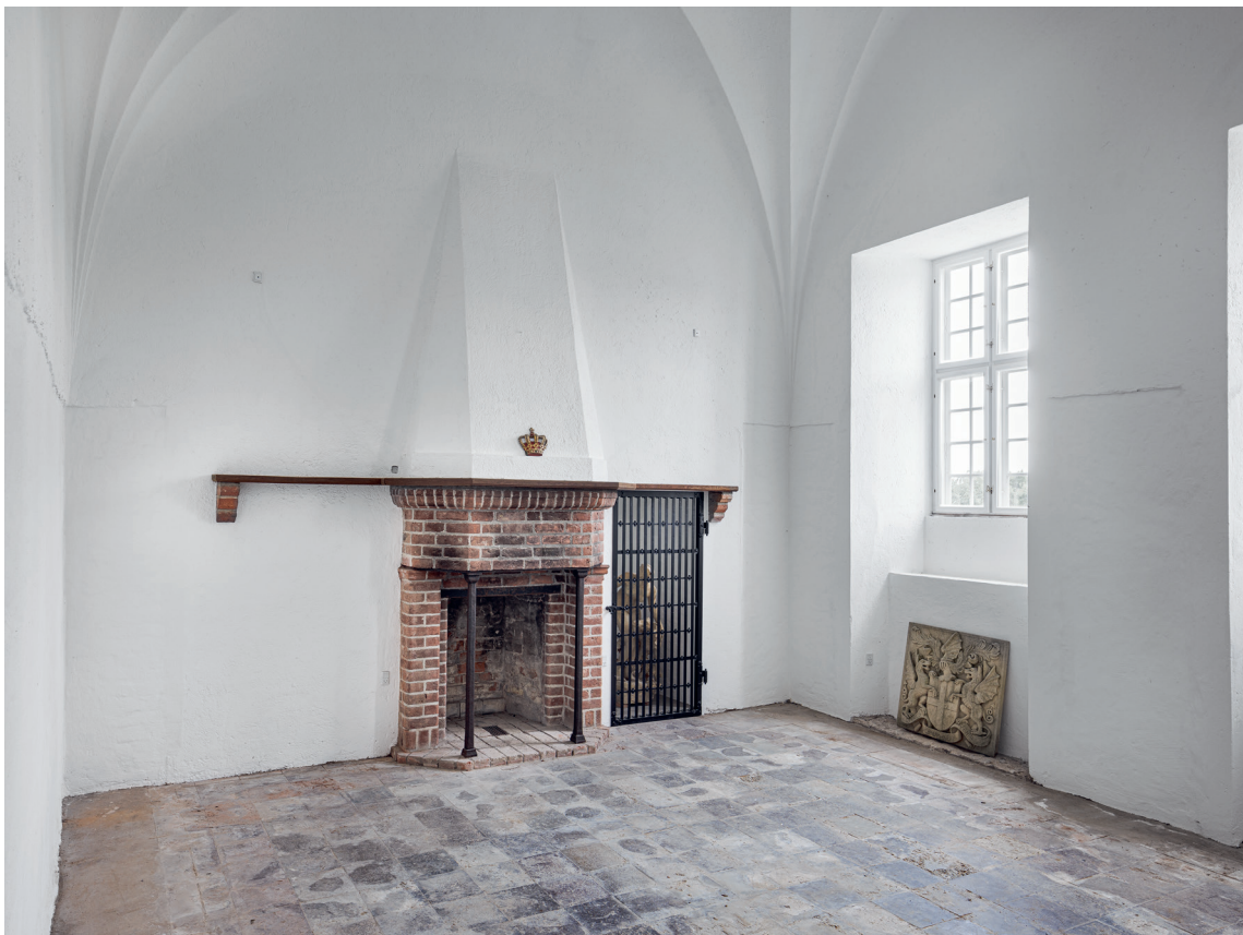
Fig. 2. Indre set mod sydøst. – Interior looking south east.

Efter kapellets nedlæggelse 1800 (jf. ovf.) har rummet fungeret som bryggers eller køkken, omtalt o. 1830. 9 1923 var det billardstue, 10 og det står i dag tomt.