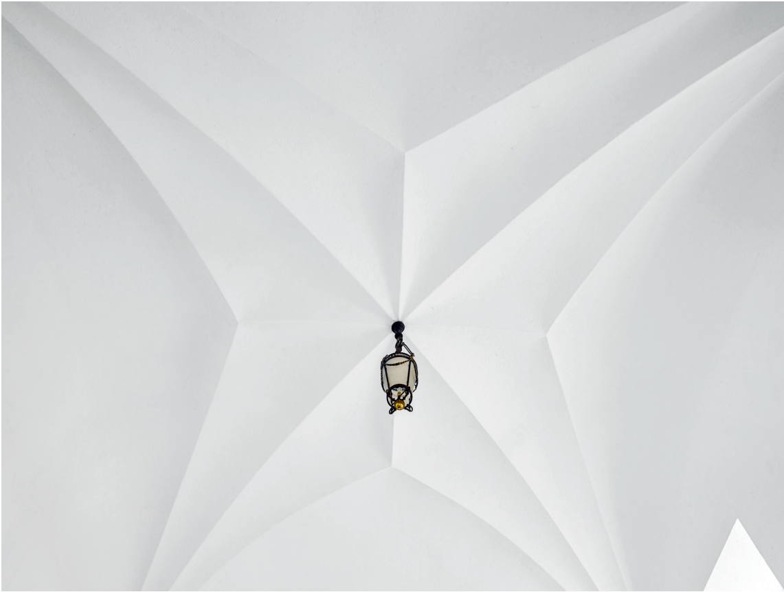
Fig. 4. Stjernehvælv set mod øst (s. 3613). Foto Arnold Mikkelsen 2022. – Star vault looking east.

er formentlig sket 1912–13. I østvæggen er der en nok oprindelig, muret kamin , hvorved der er en formentlig nyere niche med luge til skorstenen. Et oprindeligt stjernehvælv , som hviler på vederlag i murene, dækker rummet (fig. 4).