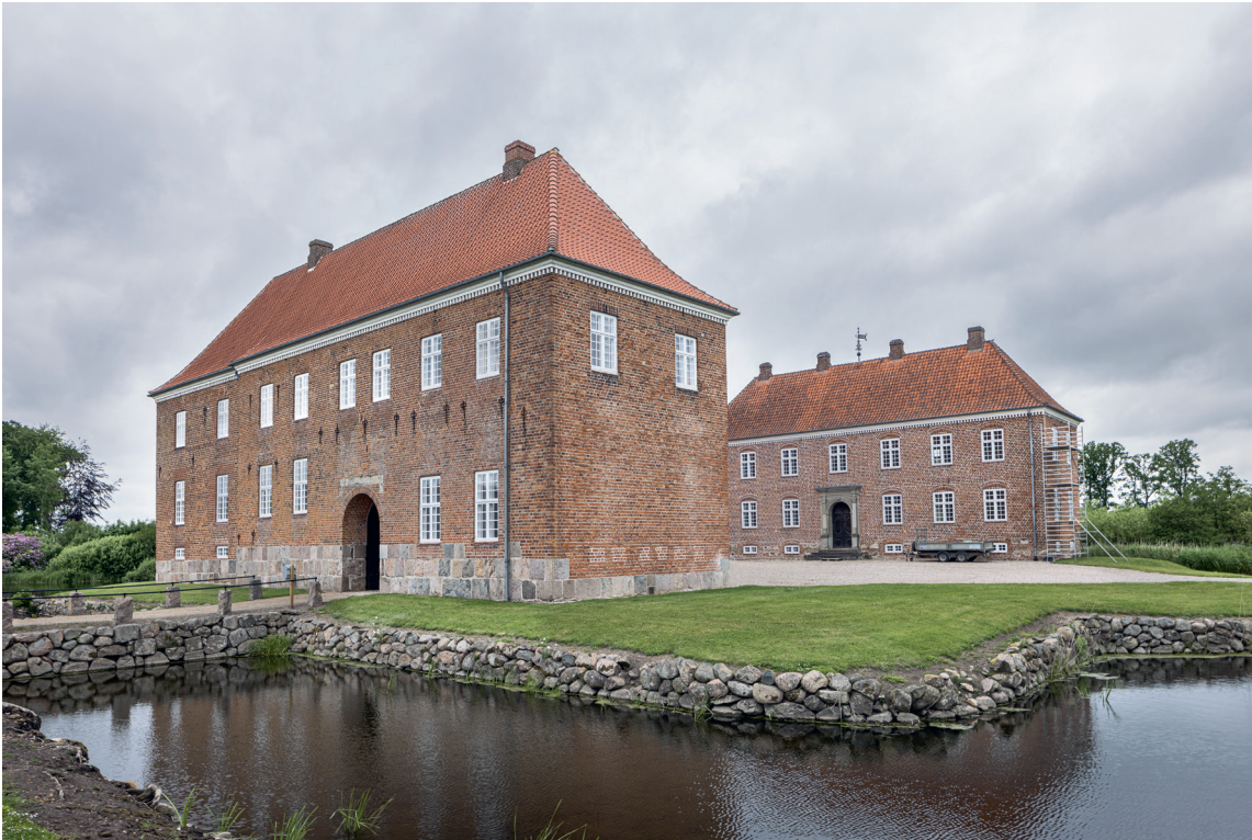
Fig. 1. Herregården set fra sydøst. – The manor house seen from the south east.