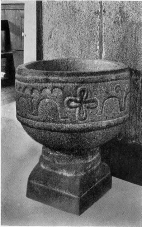
E. M. 1938