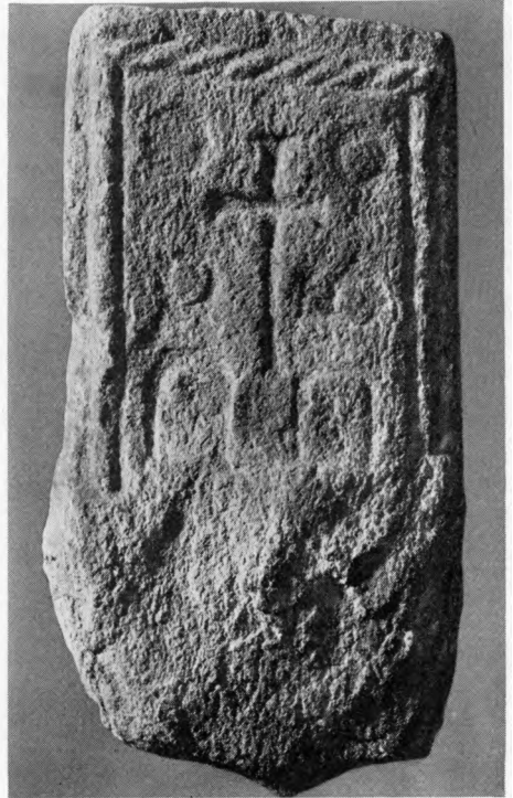
E. M. 1938