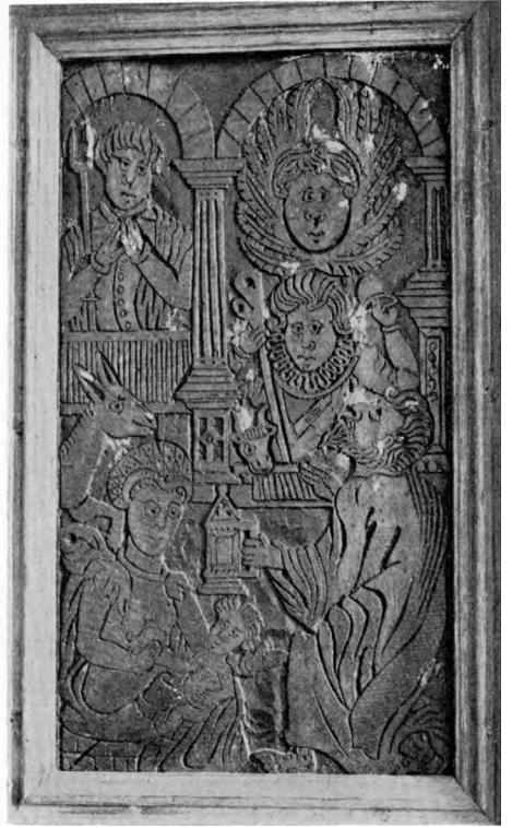
E. M. 1938