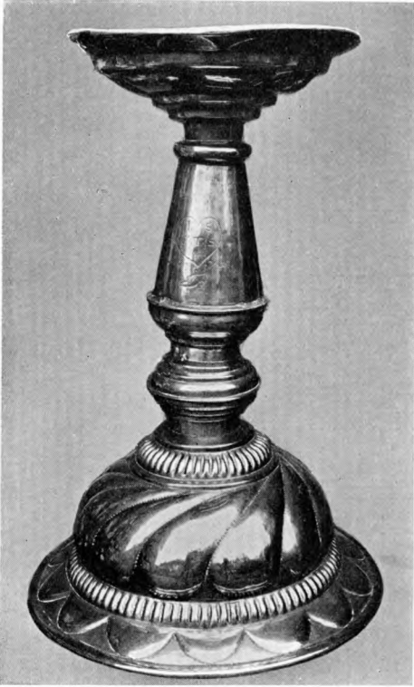
V. H. 1929