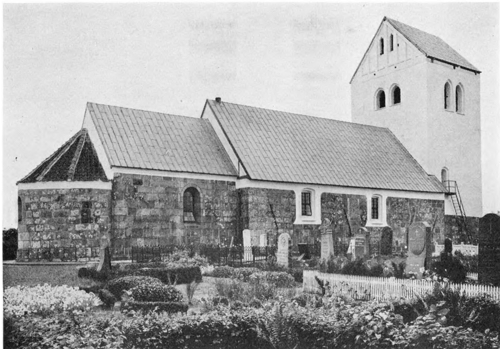
Fig. 1. Hvidbjerg. Ydre, set fra Nordøst.