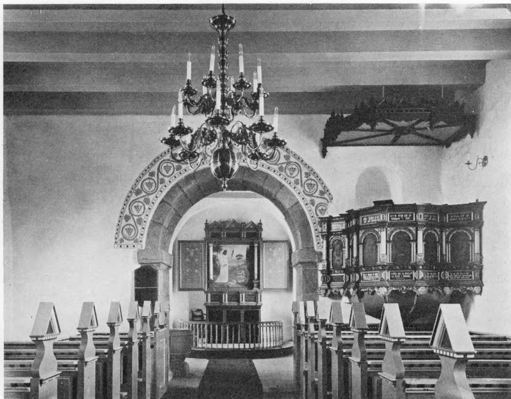
Fig. 3. Hvidbjerg. Indre, set mod Øst.