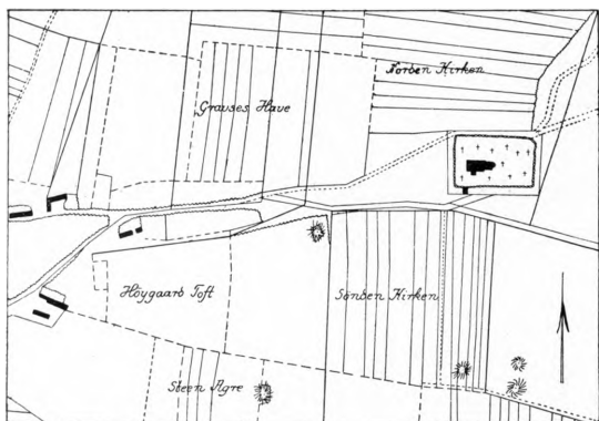
Fig. 5. Hvidbjerg 1790.