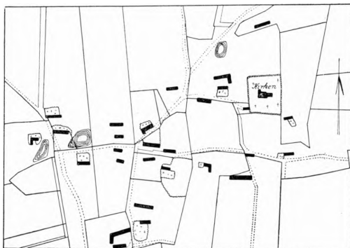
Fig. 6. Rested 1794.