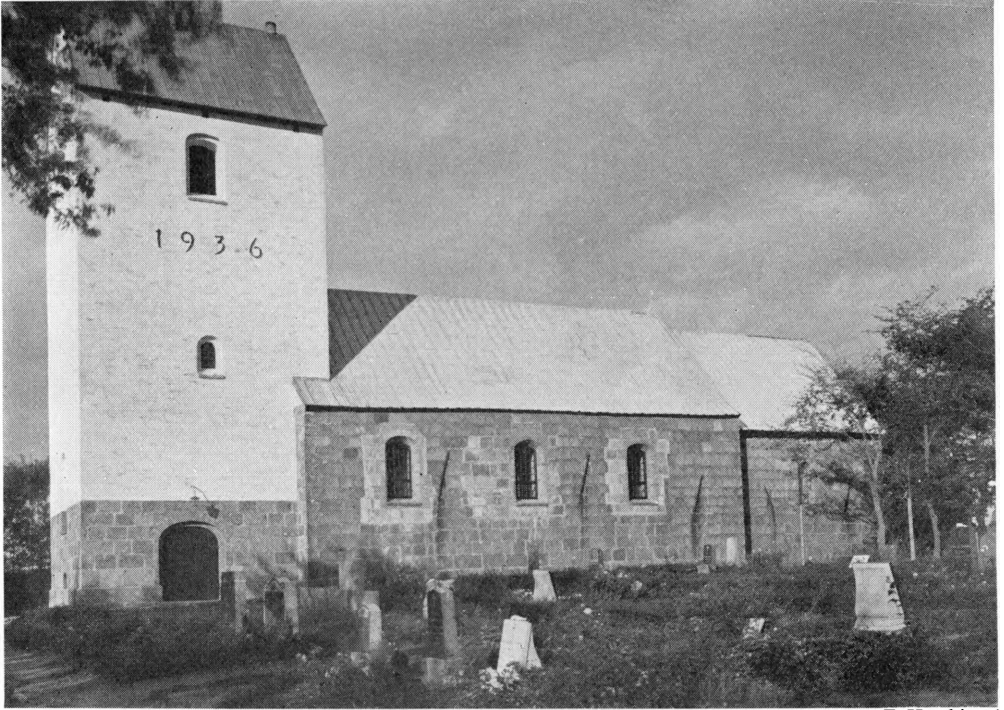
Fig. 1. Rsted. Ydre, set fra Sydvest.