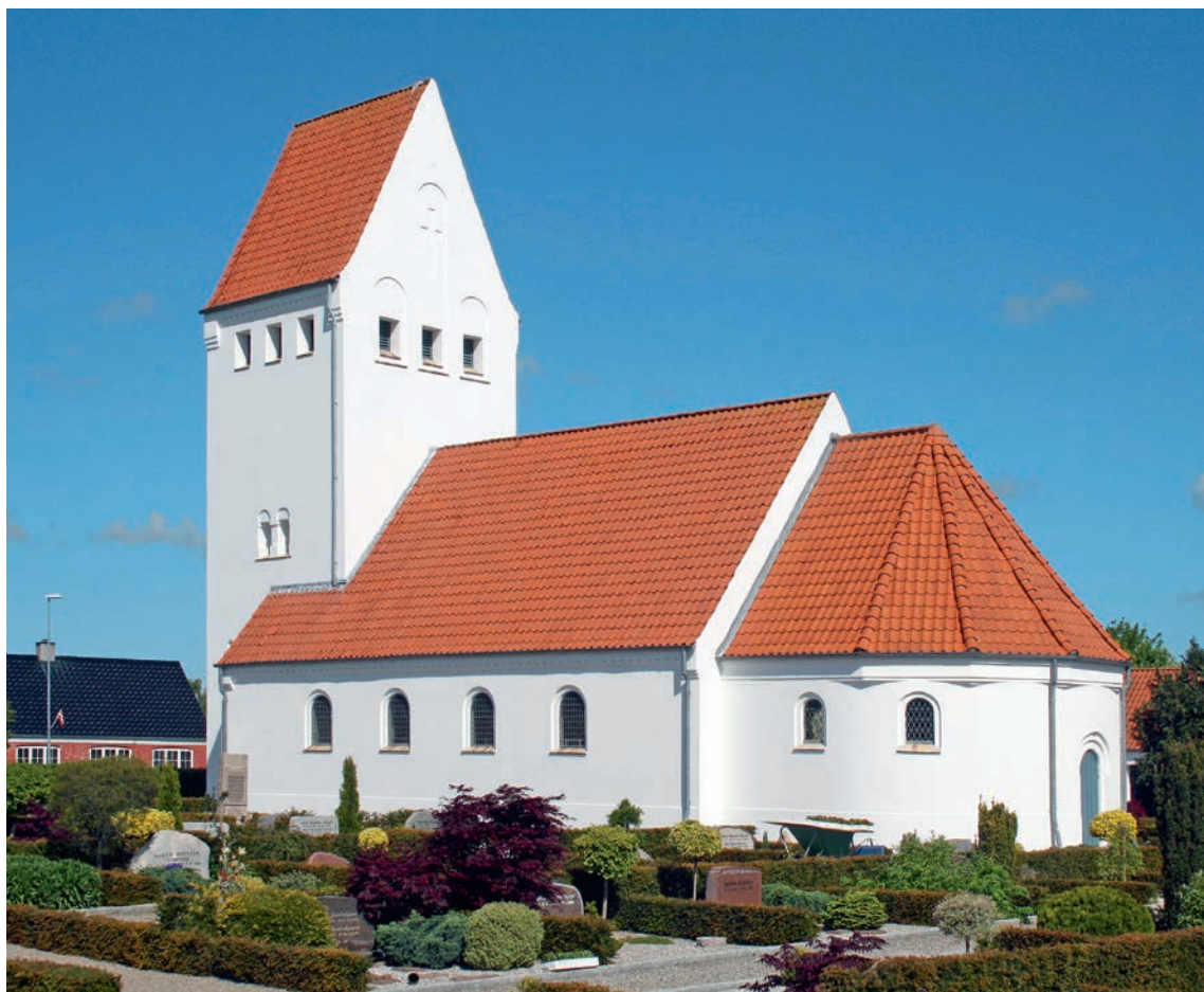
Fig. 1. Kirken set fra sydøst. Foto Ebbe Nyborg 2015. – The church seen from the south east.