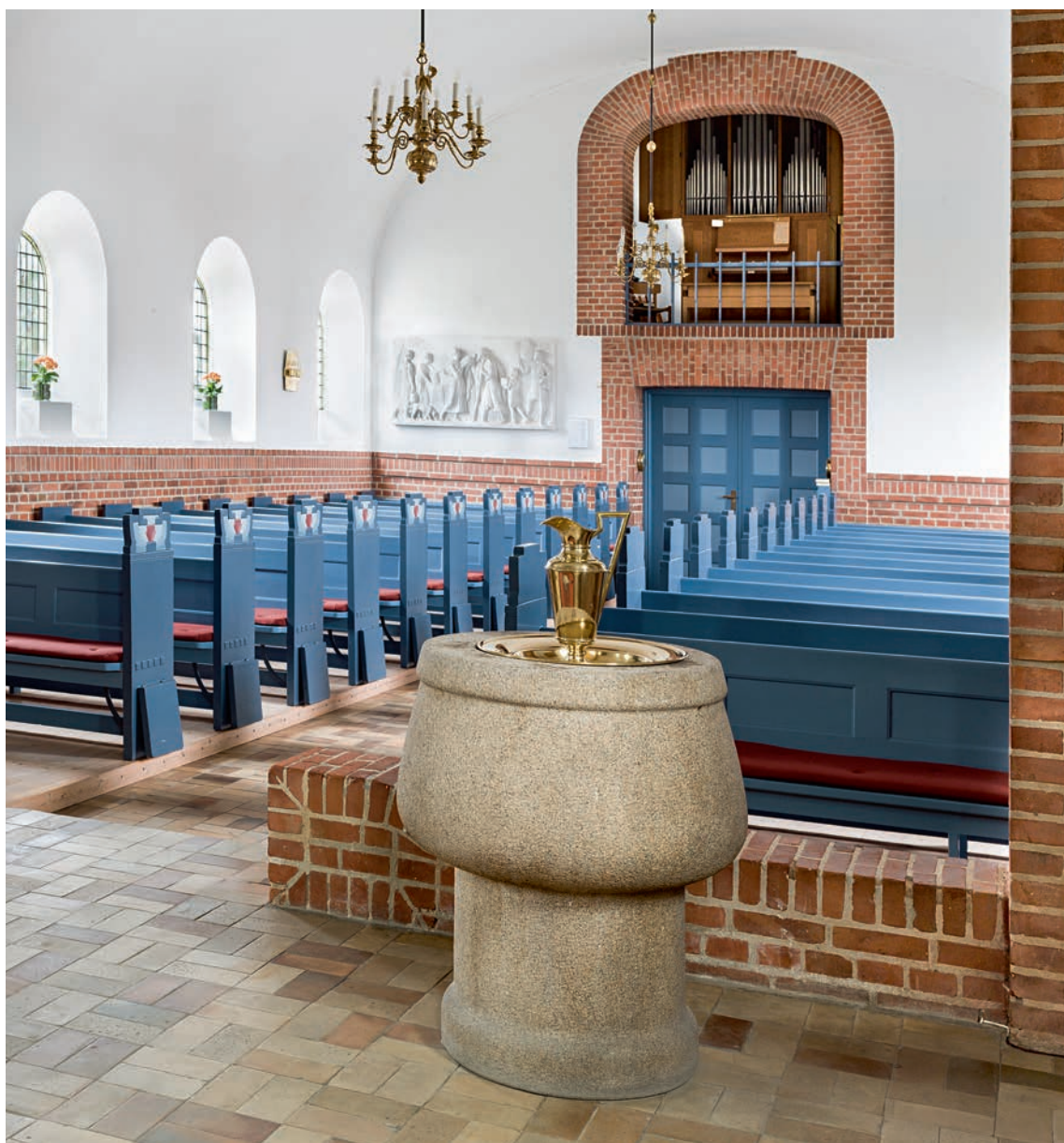
Fig. 5. Indre set imod vest. Foto Arnold Mikkelsen 2015. – Interior seen towards the west.