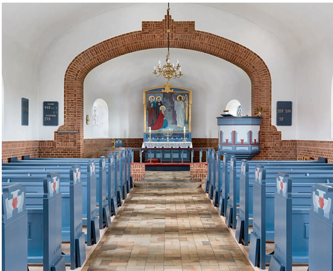
Fig. 2. Indre set imod øst. – Interior seen towards the east.